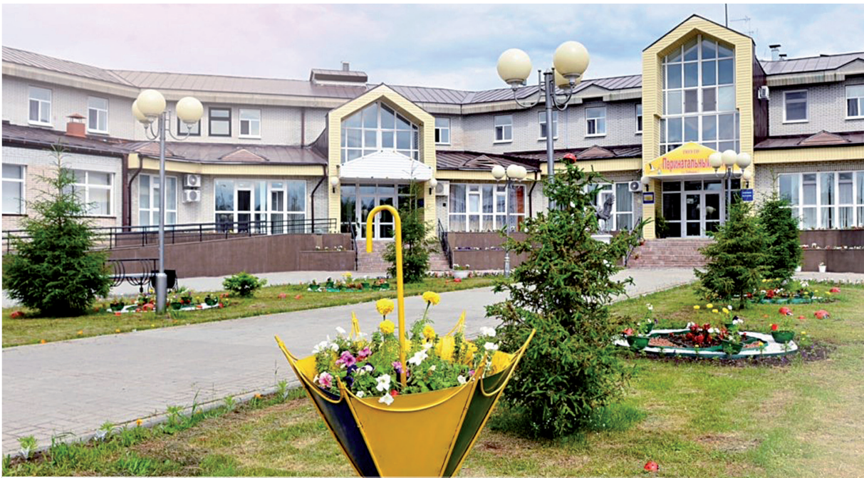
Численность жителей в регионе впервые превысила 1,5 млн человек

случае в России, присваивать аэропортам имена населённых пунктов, которые были или до сих пор находятся в непосредственной близости от воздушных ворот того или иного города. В Москве есть «Шереметьево», «Домодедово» и «Внуково», в Новосибирске – «Толмачёво», в Томске – «Богашево», в Красноярске – «Емельяново», в Норильске – «Алыкель». Ну и, по нынешней моде, присвоить ей ещё и имя всемирно известного тоболяка-композитора, героя войны 1812 года Александра Алябьева. Хотя бы потому, что имя другого великого тоболяка, Дмитрия Менделеева, почему-то присвоили тюменскому аэропорту «Роцино». Впрочем, вернёмся к успехам региона. Область заняла третье место в Национальном рейтинге состояния инвестиционного климата. Завод по переработке картофеля ООО «КриММ» открыли