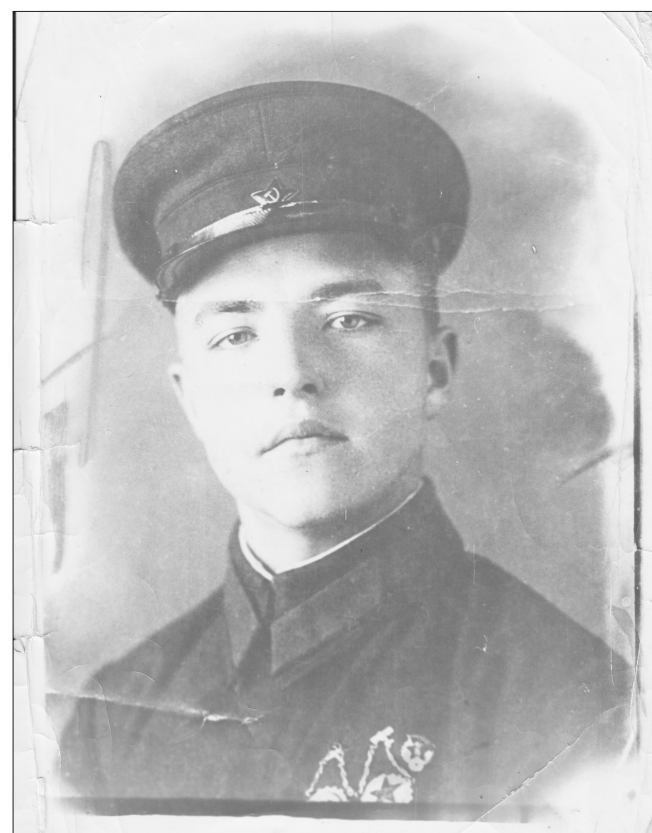
Продолжение на 8 стр.

С 12 ноября 1941 года части 384-й стрелковой дивизии по железной дороге начали переброску на фронт, где дивизия вошла в состав 58-й армии Архангельского военного округа, а в феврале 1942 года - в состав 11-й армии Северо-Западного фронта. В боях под Старой Руссой 384-я дивизия потеряла до 80 % личного состава в непрерывных и бессмысленных атаках на немецкие пулемёты, когда каждый выстрел - чья-то по-