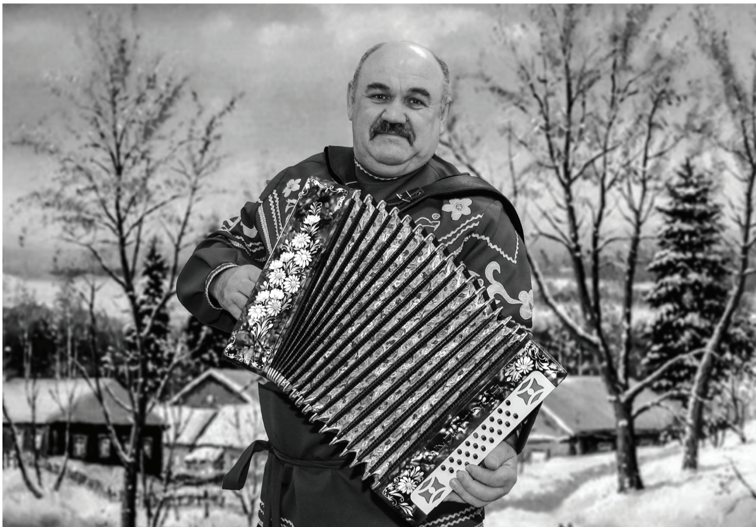
Сотрудники РДК оценили звучание музыкального национального инструмента. // Коллаж Владимира ВИДАНОВА

Если вы забыли или не успели оформить подписку на нашу газету, можете сделать это в январе, и издание будет приходить вам с 1 февраля. Подробная информация о подписке – на 3 странице.