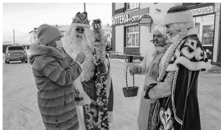
Сладковцам подарили хорошее настроение.

В учреждениях культуры Сладковского района в этот день прошли развлекательные мероприятия для населения. В том числе и в РДК. Работники районного Дома культуры, наряженные в яркие и красочные костюмы, вышли на улицу. Румяные от мороза, с пожеланиями здоровья и добра они поздравили всех встречающихся