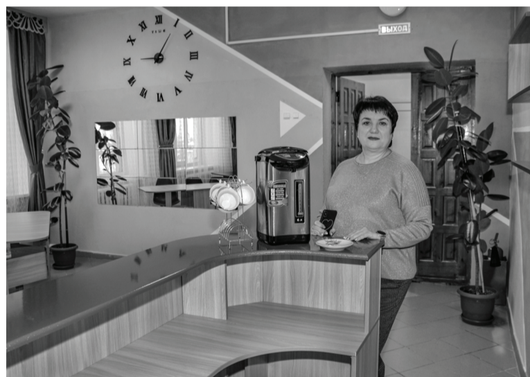
Обустроенные зоны нового креативного проекта.

«Интеллектуальный ринг» – зона работы в маленьких группах, игровых для пользователей различных возрастов, проведения турниров по настольным и настольным играм,