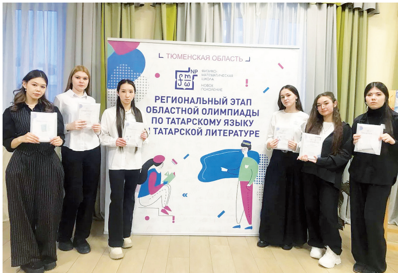
► Умницы из Ачир.

Любовь к родному слову, уважение к истокам и верность традициям культуры сибирских татар вновь продемонстрировали школьники из Ачир на региональном этапе олимпиады по татарскому языку и литературе.