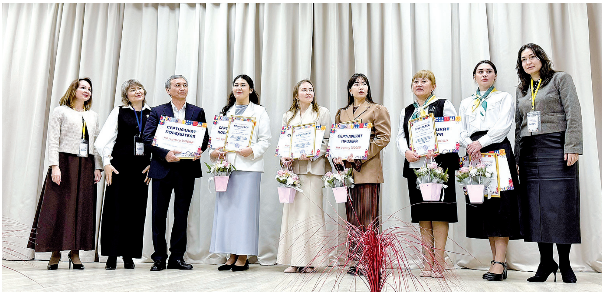
► Победители и призёры конкурса – словом, профессионалы.