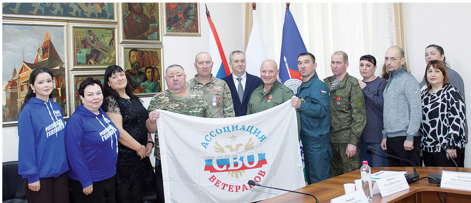
► Родилась новая организация