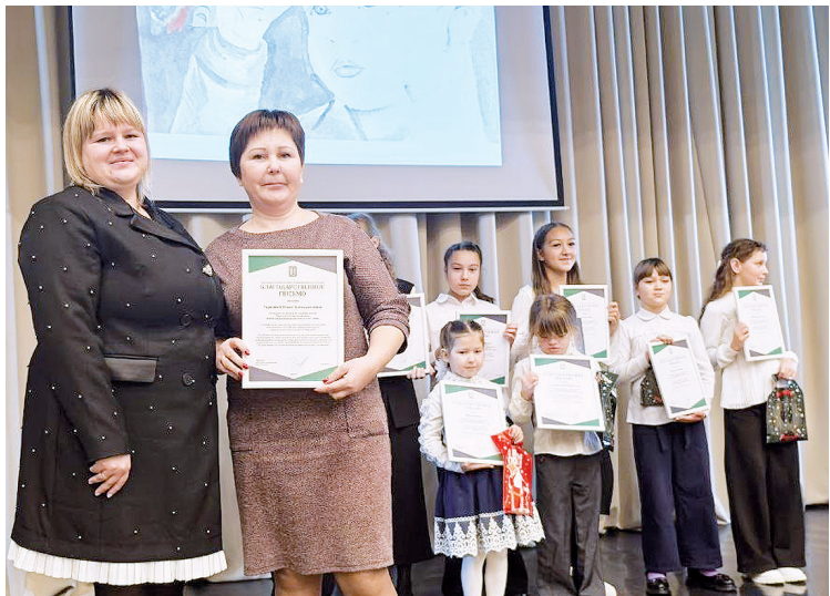
► Дипломы – за творческие муки, вдохновение, память.

Ведь буквально накануне, на торжественной церемонии в честь 35-летия МЧС России и 40-летия 8-го пожарно-спасательного отряда Главного управления МЧС России по Тюменской области этому совсем ещё юному парню была вручена высокая награда – медаль «За спасение на пожаре». Её старший сержант внутренней службы, помощник отделения 8-го пожарно-спасательного гарнизона 37-й пожарно-спасательной части получил за отвагу и самоотверженность, проявленные во время тушения пожара. В экстремальной ситуации он проявил решительность и высокий профессионализм.