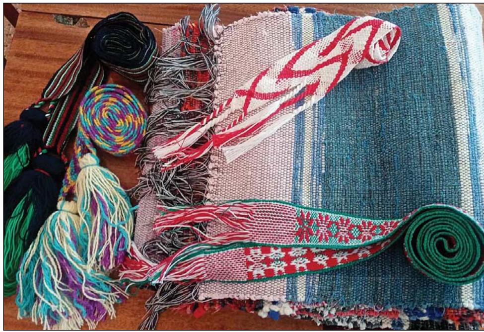
• Изделия, созданные в творческой мастерской.