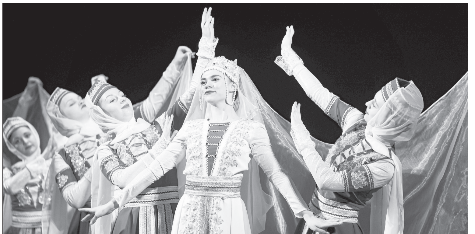
Больше всего конкурсных номеров было представлено в направлении «Хореография»

В Ялуторовске завершился Мамонтовский фестиваль