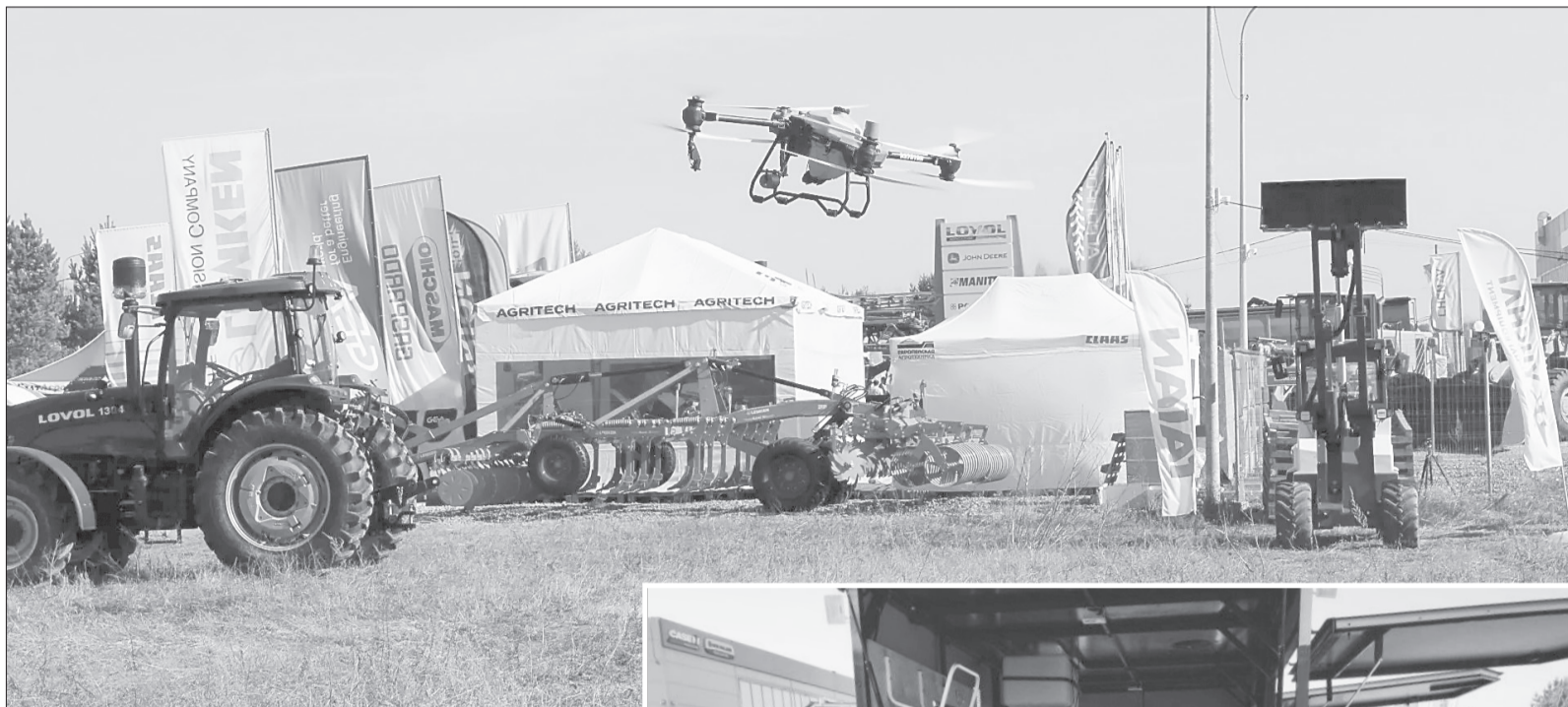
БПЛА выполняли демонстрационные полёты в течение двух дней выставки

У себя мы коптеры не применяем, это связано с прохождением множества согласований и массой действующих ограничений, а также необходимостью постоянной