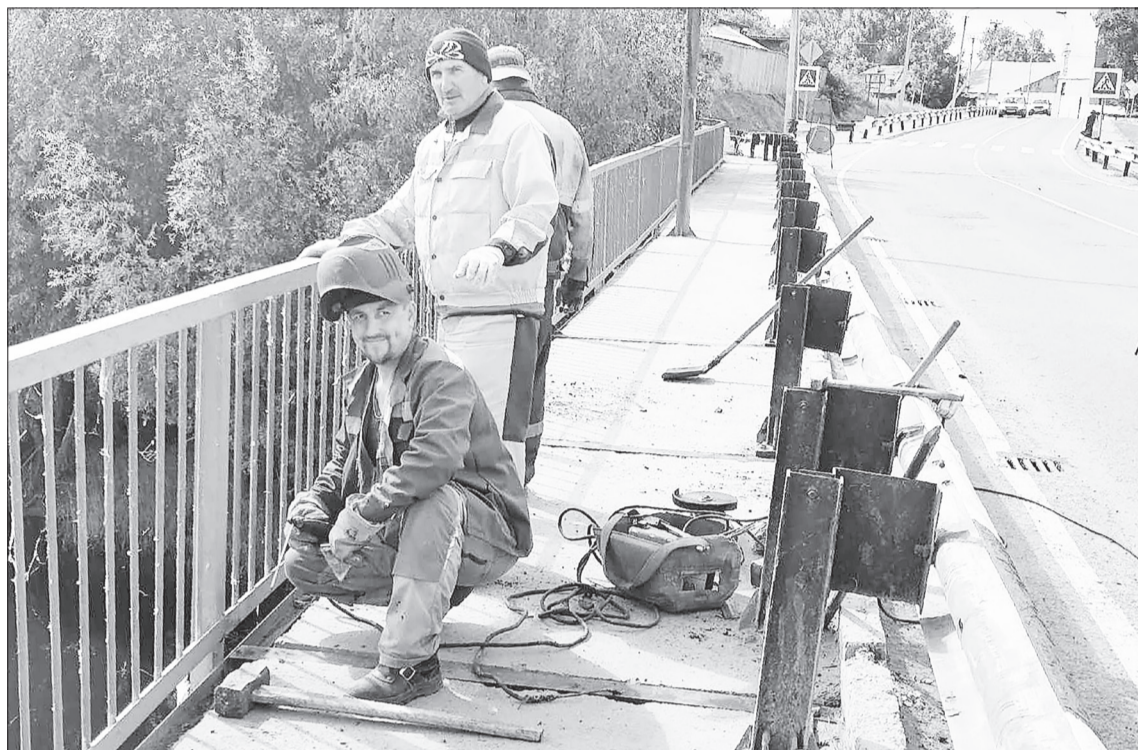
Ремонт моста через реку Саранка.

Перед праздником коллектив подвёл итоги сезона, и они оказались хорошими. Помимо планового обслуживания был выполнен ремонт дорог как муниципального, так и регионального значения. По муниципальным контрактам заасфальтировано 1 130 м 2 дороги на ул. Карла Маркса в с. Иска, отсыпано щебнем с устройством кюветов 650 м 2 на ул. Щорса в Нижней Тавде, выпол-