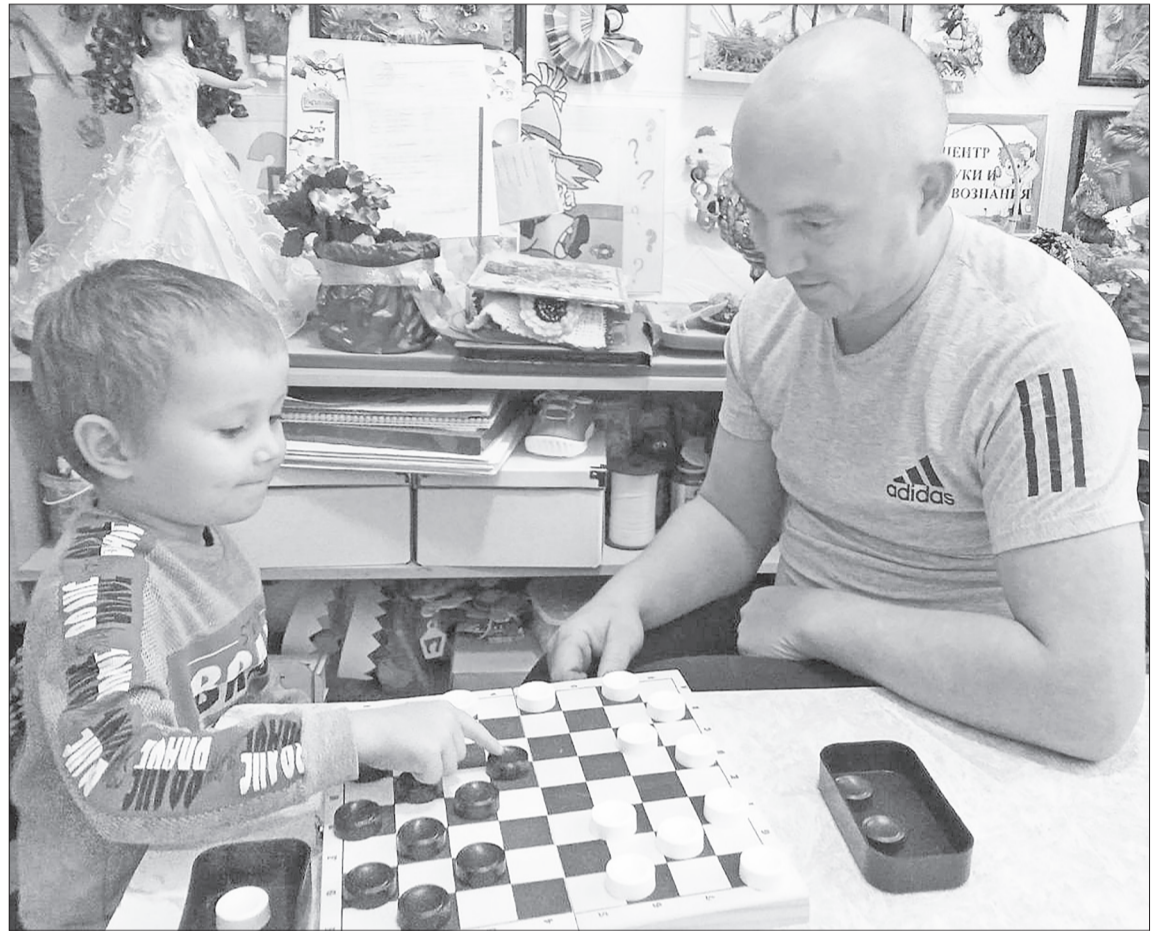
Здорово проводить время с папой за любимым занятием.

Сотрудники Черепановского детского сада и воспитанники поздравили всех пап нашего района: «Вы бесконечно нужны и вашим детям, и мамам ваших детей! Будьте сильны, надёжны, милосердны и мудры! С днём отца!». Эти добрые слова были отправлены и тем, кто сейчас находится в зоне проведения специальной военной операции.