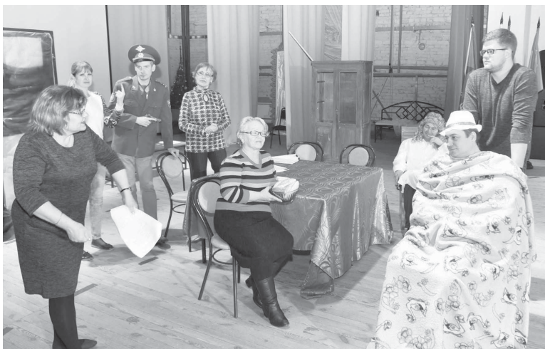
Репетиция спектакля «Тетки»