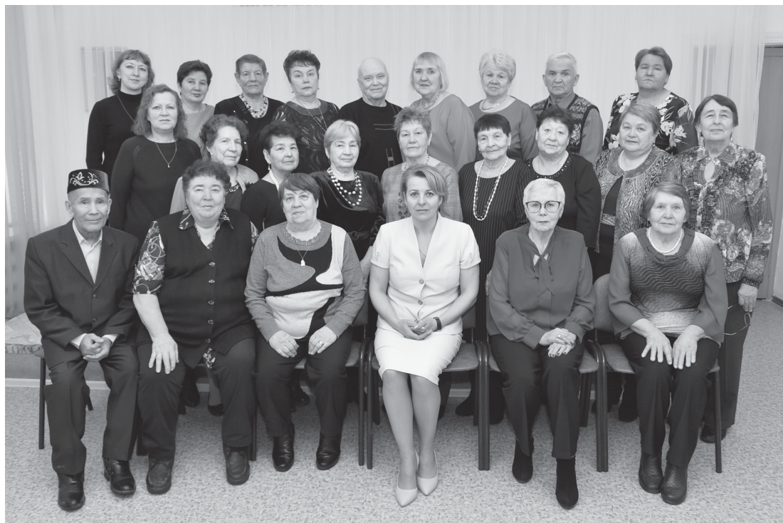
Ветераны педагогического труда Ярковского района