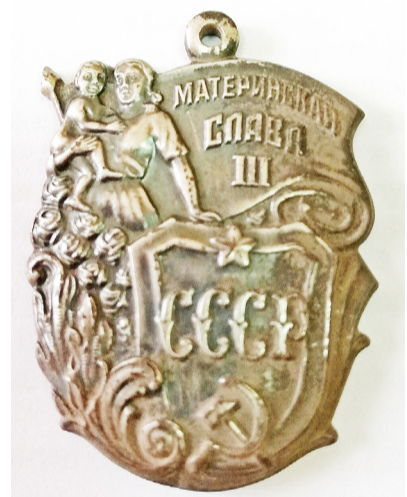
Орден «Материнская слава». Найден в с. Казанском в 2023 году

При награждении учитывались усыновлённые дети, а также погибшие или пропавшие без вести при исполнении обязанностей военной службы, при защите Родины и спасении человеческой жизни, во время охраны социалистической собственности и правопорядка, умершие вследствие ранения, увечья или профессионального заболевания.