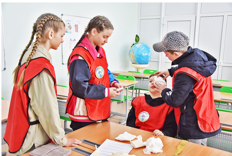
Конкурсанты наглядно показали, как правильно наложить повязку при травме глаза

Пять команд в составе школьников района приняли участие в районном конкурсе юных инспекторов дорожного движения «Безопасное колесо», который состоялся на базе Казанской школы