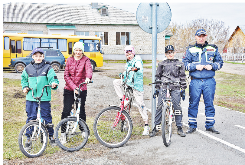
Перед стартом в автогородке автоинспекторы провели школьникам инструктаж

– Первое, что нельзя делать с глазом – это тереть его. Лучше все-