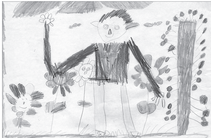
Самира Гафизова, 5 лет