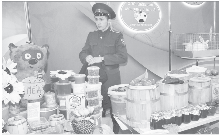
Экспозиция Ялutorовского района пестрела разнообразием: здесь было всё - от разносолов до кроликов