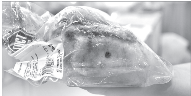
Вот шматок ароматного сала, чтобы жизнь веселее стала