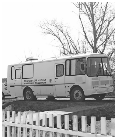
В областной больнице № 11 имеются автобусы «ПАЗ», оснащённые диагностическим оборудованием и рабочими местами для персонала

Последние два года в малонаселённых пунктах Голышмановского округа профилактические медицинские осмотры проходят в передвижных комплексах.