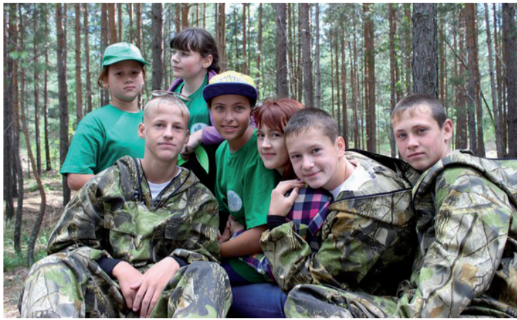
Солобоевские лесничие со своими новыми знакомыми

Творческие способности и умение в приготовлении пищи необходимо было продемонстрировать в конкурсе «Лесной кулинар». Каждая команда