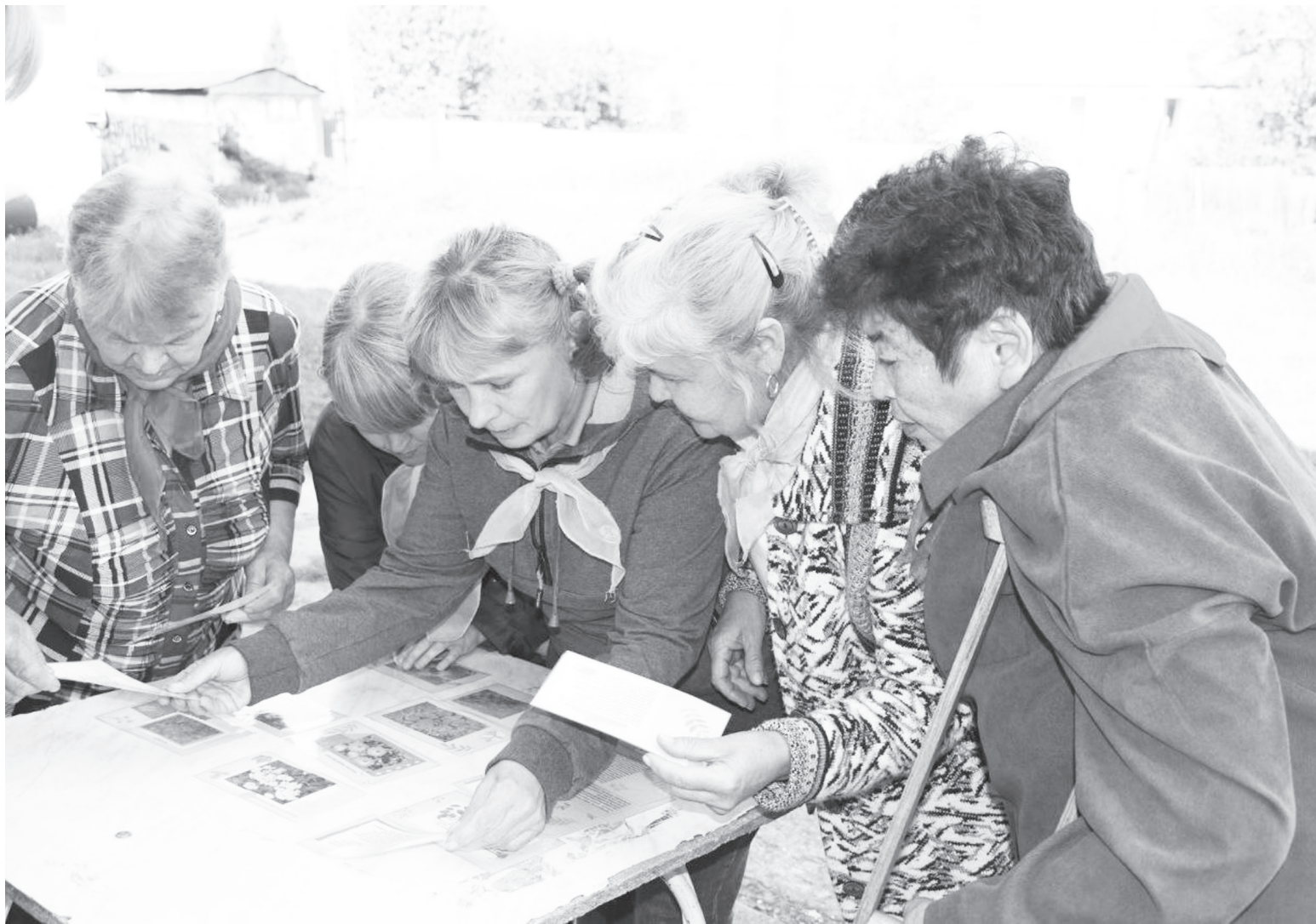
|| На этапе «Определение растительности». Фото автора