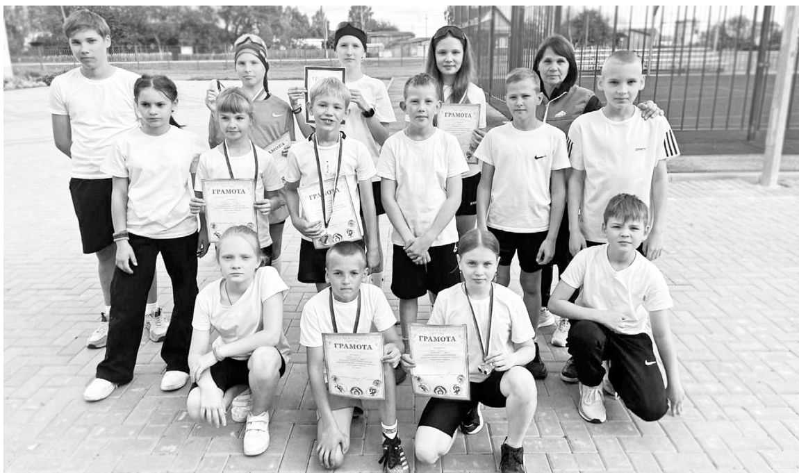
|| Команда-победитель из села Рассвет.

– Считаю, что фестиваль выполнил все поставленные задачи по пропаганде спор-