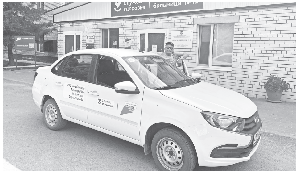
|| Фото из архива областной больницы № 13

тов. Новая техника существенно повысила оперативность оказания медицинской помощи. За полгода каждый автомобиль преодолел более 10000 км, доказав свою надёжность и эффективность в работе. Новые LADA Granta позволяют медицине стать более доступ-