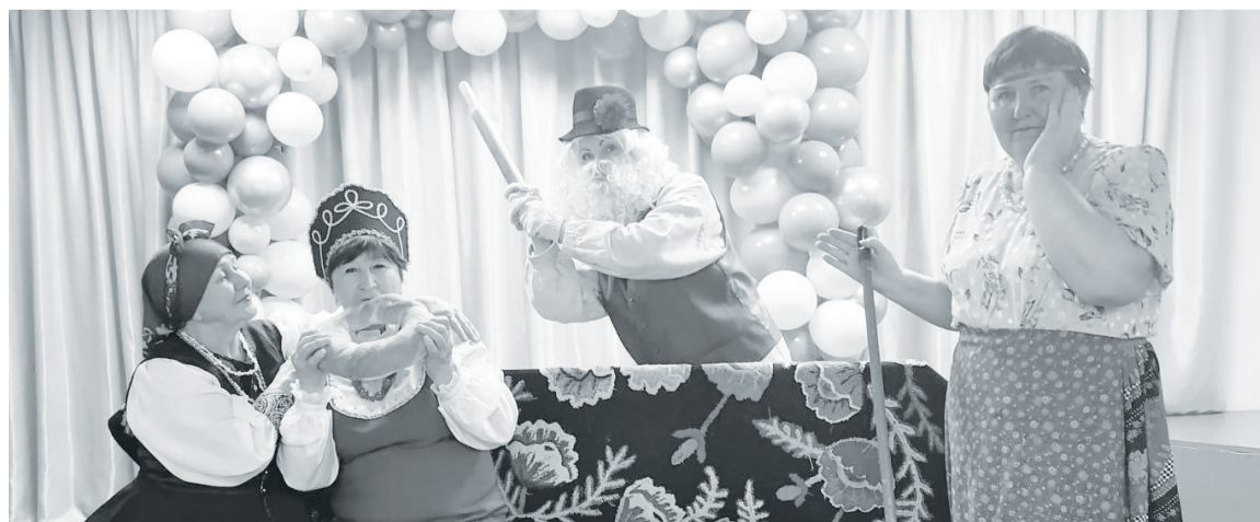
Пенсионеры в День пожилого человека показали представление «Как аукнется, так и откликнется».

Татьяна КРЮЧИХИНА.