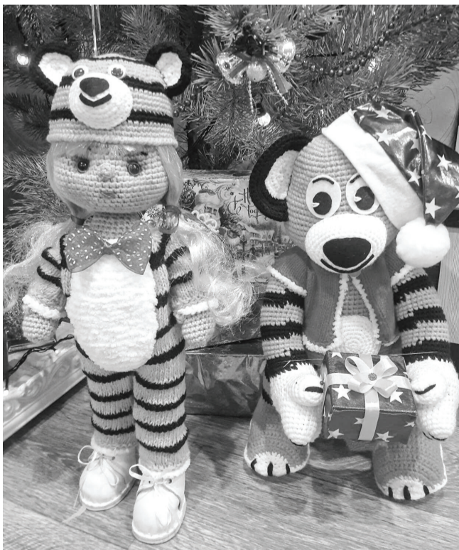
Каждый Новый год появляются в коллекции Натальи Владимировны куклы – символы года. Ныне она связала весёлого Тигрёнка. Под елкой ему самое место вместе с самодельными Дедом Морозом и Снегурочкой.

на национальных культур и ремёсел. Каждая – произведение искусства, похожих нет. С точностью шьёт мастерица наряды, придаёт внешности кукол восточный колорит, широко распахивает глазки славянкам. Освоила