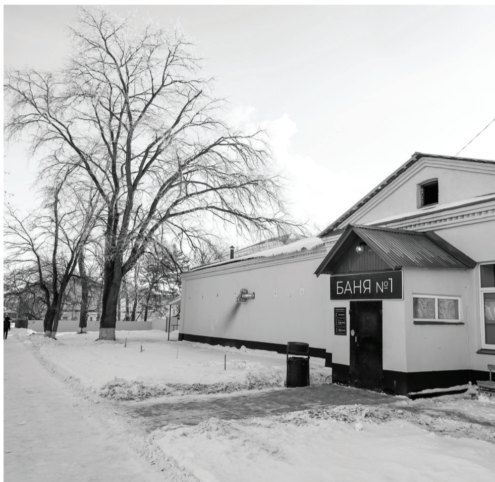
Баня по ул. Пушкина в прошлом году была продана в частные руки, сегодня предприниматели развивают бизнес и ищут варианты привлечения посетителей.

Одна из главных изюминок «Бани № 1» (ее новое название) в том, что она на дровах – это совсем другое качество пара. А вскоре здесь будет работать пармейстер – профессиональный парильщик,