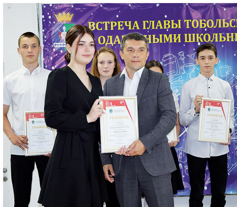
► Награды получают юные олимпийцы