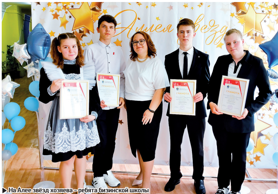
На Алее звёзд хозяева – ребята бизинской школы

Стихли аплодисменты, подошёл к концу учебный год. На «Школьной аллее звёзд» появились новые имена, призы и подарки нашли своих героев. Хочется пожелать юной смене новых свершений, ярких побед на небосклоне ученической жизни!