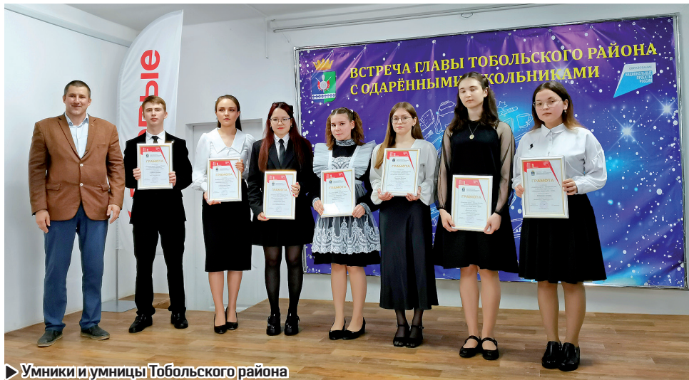
Умники и умницы Тобольского района