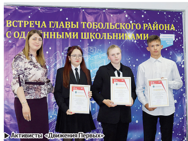
Активисты «Движения Первых»

Самая, пожалуй, многочисленная группа номинантов – это призёры и