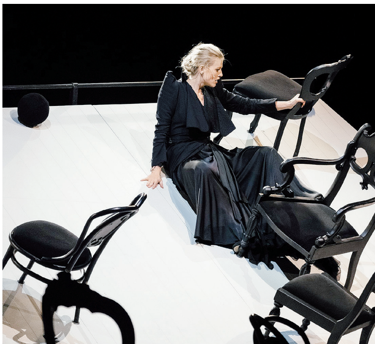
► Анна Каренина катится по наклонной

– Когда сформировали афишу фестиваля, поняли, что многие спектакли – про изменения, про перелом судеб. В рамках фестиваля вы увидите спектакли о Великой Отечественной войне, а также 1917 год – переломные исторические эпохи, меняющие не отдельные человеческие жизни, а судьбы народов. Афишу прекрасно дополнили произведения Льва Николаевича Толстого, традиционно ставящие в центр изменения человека через события, в которых он оказывается. Более того, эскиз спектакля, посвящённого Дмитрию Ивановичу Менделееву, – тоже история перелома: его деятельность изменила