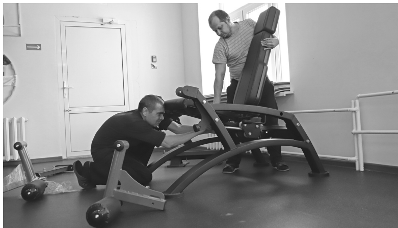
Представители поставщика ООО «Спортивная элита» монтируют оборудование