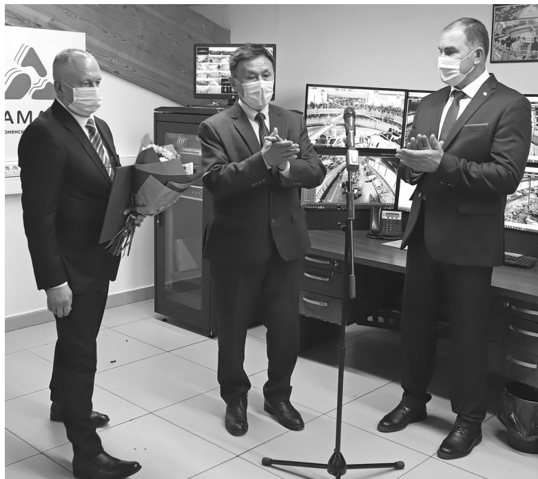
Онлайн-награждение провели на самом крупном за Уралом животноводческом комплексе – ООО «Тюменские молочные фермы»

В нашем округе праздник, посвящённый Дню работника