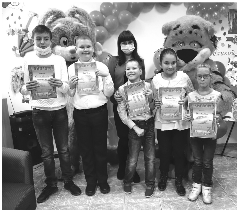
Проект центра социальной помощи «Исток» позволил детям показать своё творчество и таланты в разных номинациях