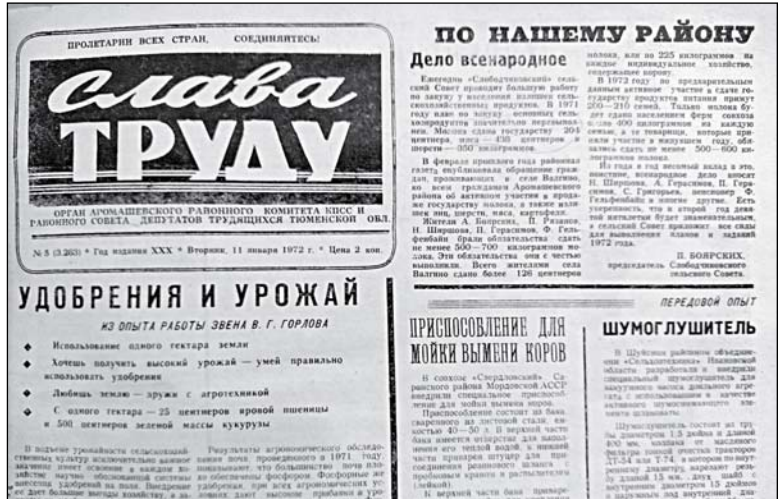
• Выпуск газеты «Слава труду» № 5 от 11 января 1972 года.