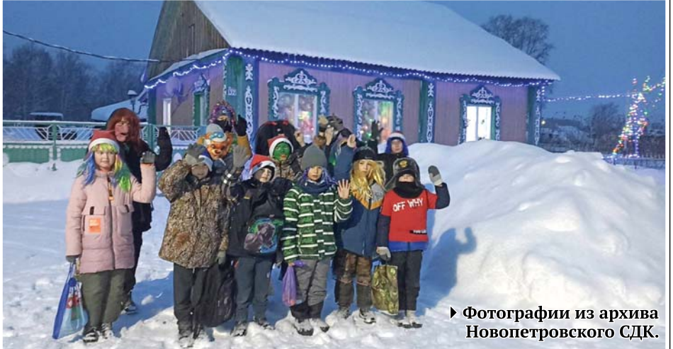
► Фотографии из архива Новопетровского СДК.