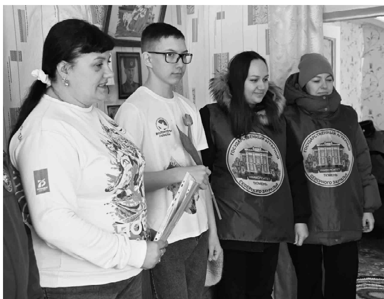
Волонтеры Победы и другие участники патриотической акции преподнесли ветерану цветы и подарки

В минувший четверг, 6 марта, в Омутинском районе побывали тюменские участники всероссийской акции «Снежный десант РСО», которая в этом году проходит под лозунгом «Десант Победы».