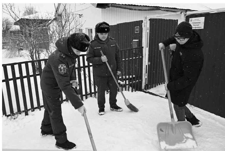
Ребята из кадетского класса МЧС расчищают снег у дома труженицы тыла в рамках «Снежного десанта»