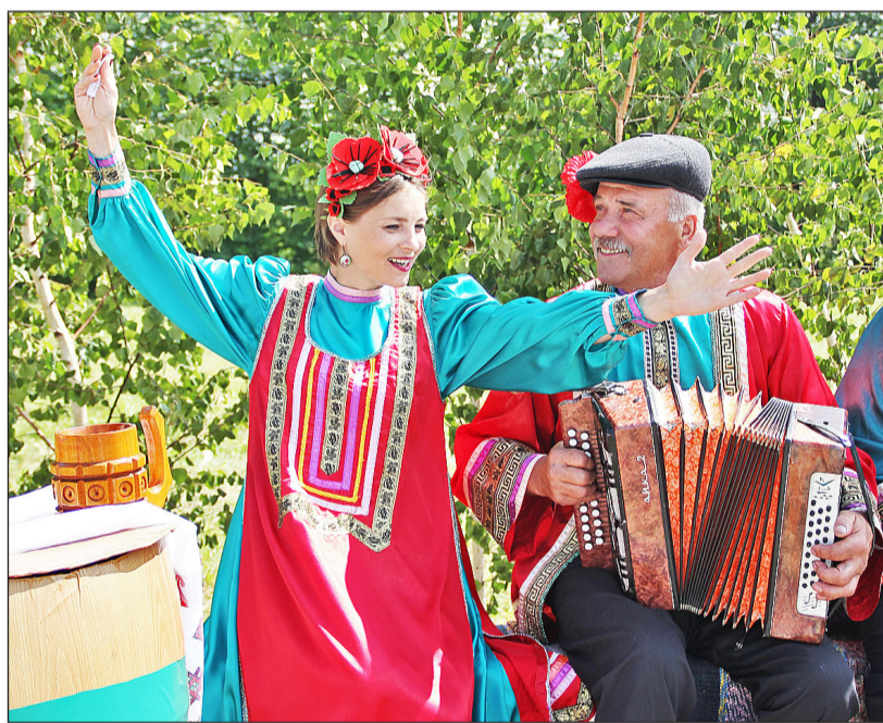
Под задорные частушки большеченчерских артистов ноги сами идут в пляс

Вкусными пирогами, разнообразной сладкой выпечкой, окрошкой и компотом угощали гостей жители п. Челюскинцев на протяжении всего праздника.