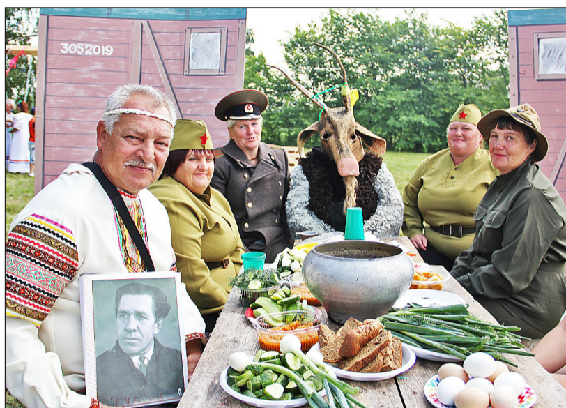
Инсценировку по сказу Ивана Ермакова «Порченые солдаты» подготовили огнёвцы