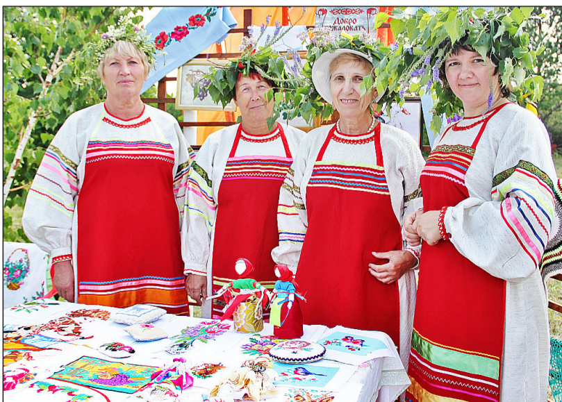
Рукодельницы из Ильинки продемонстрировали мастерство и разнообразные таланты селян