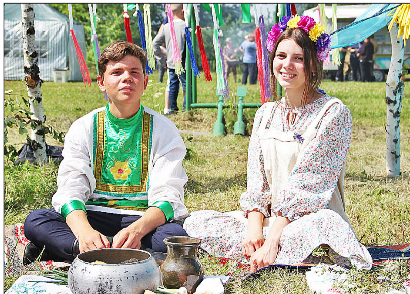
Гагарьевские ребята подготовили инсталляцию по ермаковскому сказу «Голубая стрекозка»