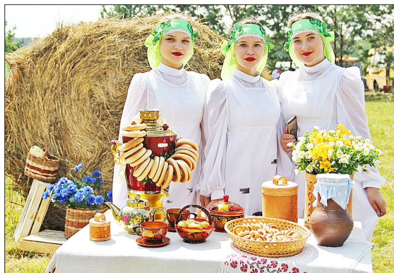
Вот таких красивых и гордых русских женщин прославлял в своих произведениях писатель