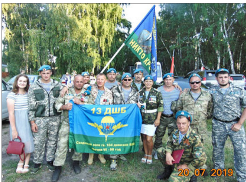
Ветераны чеченской войны верны десантным традициям