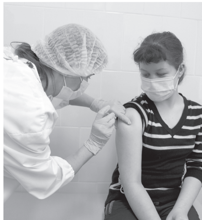
После вакцинации кратковременное повышение температуры, озноб, ломота в суставах – это нормальный ответ организма на введение вакцины. // Фото автора.

– Прививочная кампания подростков только стартовала, начали поступать первые партии вакцины, поэтому сейчас делаем акцент на вакцинации несовершеннолетних, которые стоят у нас на диспансерном учете. Прививка – дело добровольное, по желанию и с письменного согласия родителей или законных представителей,