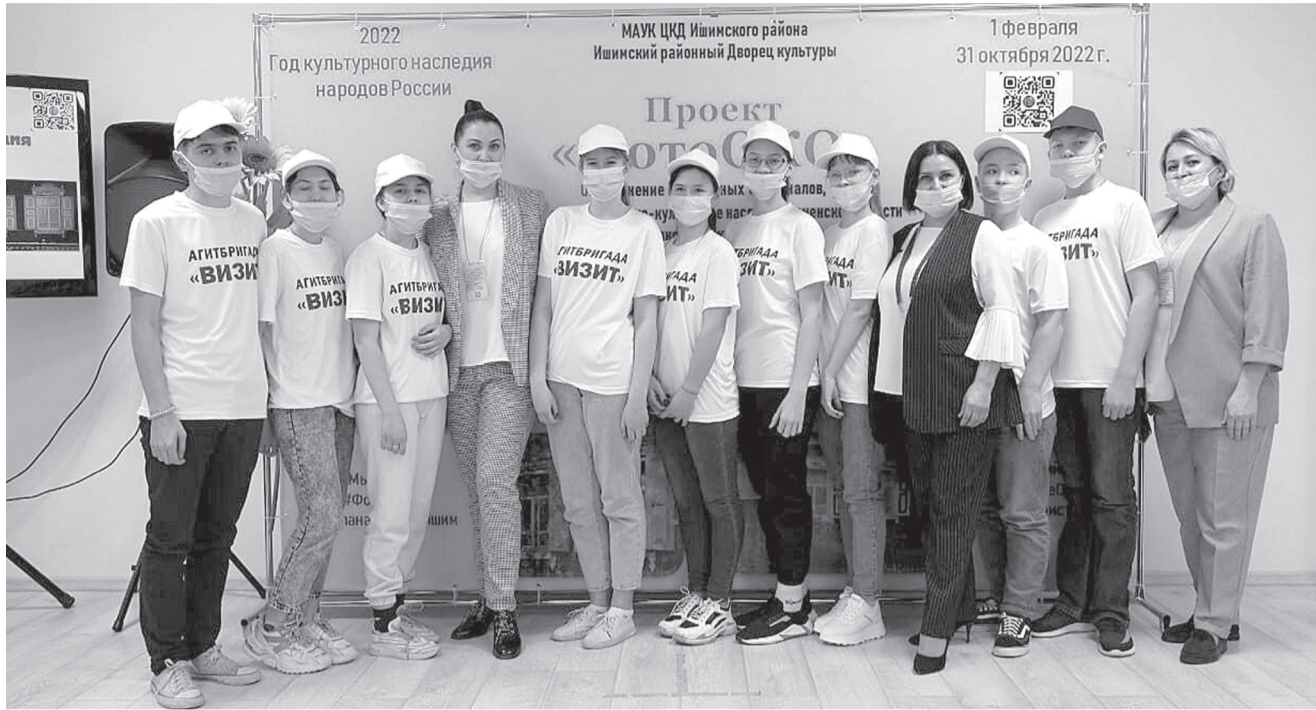
Торжественная презентация проекта «ФотоОКО» состоялась в Ишимском районном Дворце культуры.

В актуальности темы Светлана вновь убедилась, когда успешно участвовала в областном проекте «Голоса наших предков: о ремёслах и традициях» и Европейских днях наследия (European Heritage Days). Тогда Светлана показала более 500 фотографий окон с декорированными наличниками и ставнями домов Тюмени, Тобольска, Заводоуковска, Ишима, Ишимского и Бердюжского районов. Это – результат ее пятилетней работы.