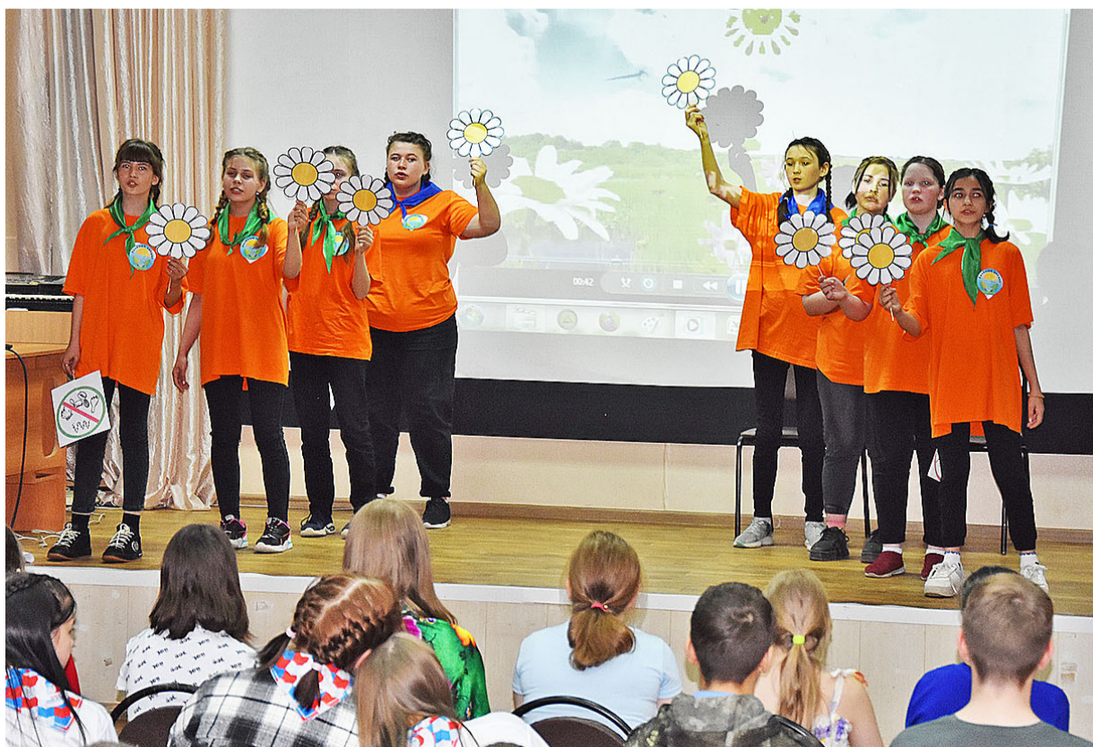
Победитель конкурса – команда «Зелёный патруль» из Смирновской школы