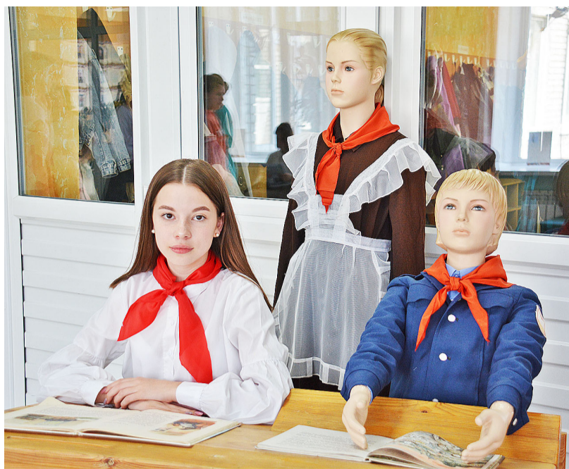
Так выглядели пионеры в XX веке