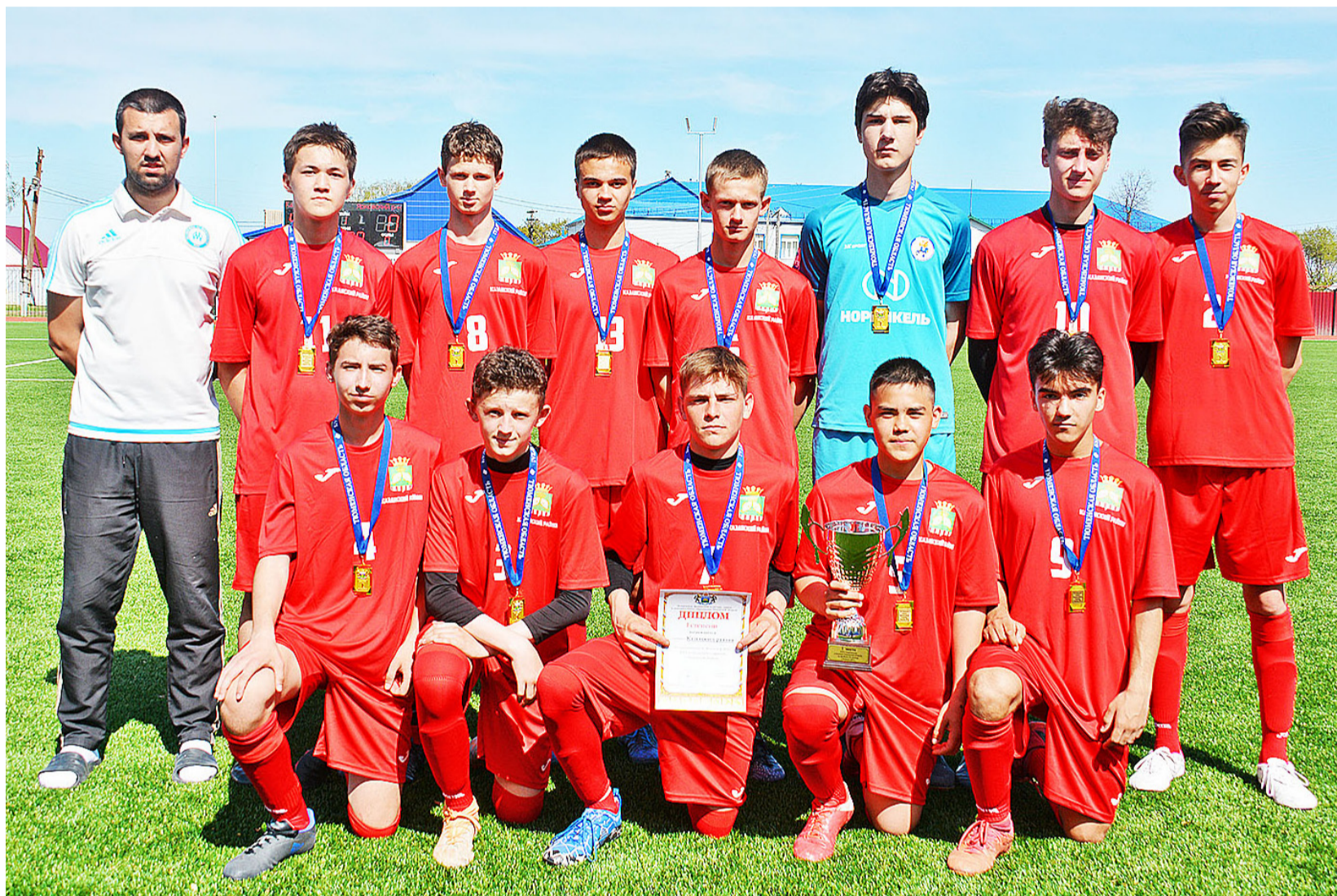
Команда победителей областной спартакиады по футболу

С 11 по 13 мая на стадионе «Юность» села Казанского состоялся финальный этап XXV спартакиады учащихся Тюменской области по футболу.