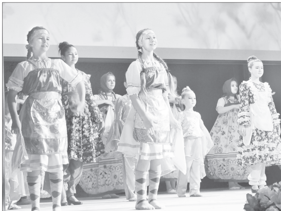
Участниками праздничного концерта стали более сотни артистов разных возрастов и национальностей из всех сельских поселений района

- Тюменская область - большое ожерелье, которое состоит из ярких жемчужин - наших горо-