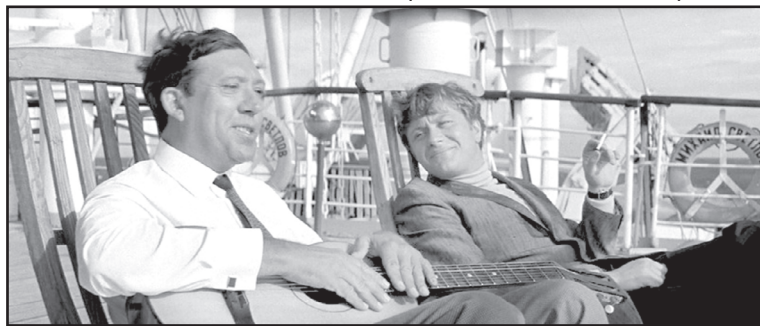
Кадр из фильма «Бриллиантовая рука»

Самым смешным и самым любимым среди всех шедевров Леонида Гайдая я считаю фильм «Бриллиантовая рука». Непревзойдённые мастера юмора Юрий Никулин — Семён Семёныч, Андрей Миронов — Геннадий Козодоев, Анатолий Папанов — Лёлик, Нонна Мордюкова — управдом стали нарицательными персонами