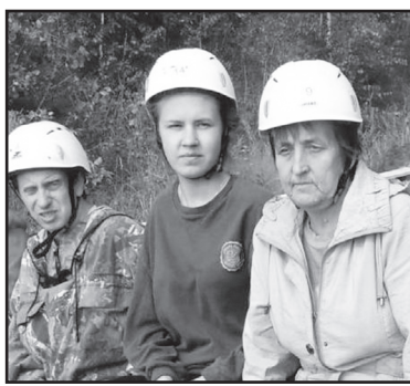
Областной туристический слёт