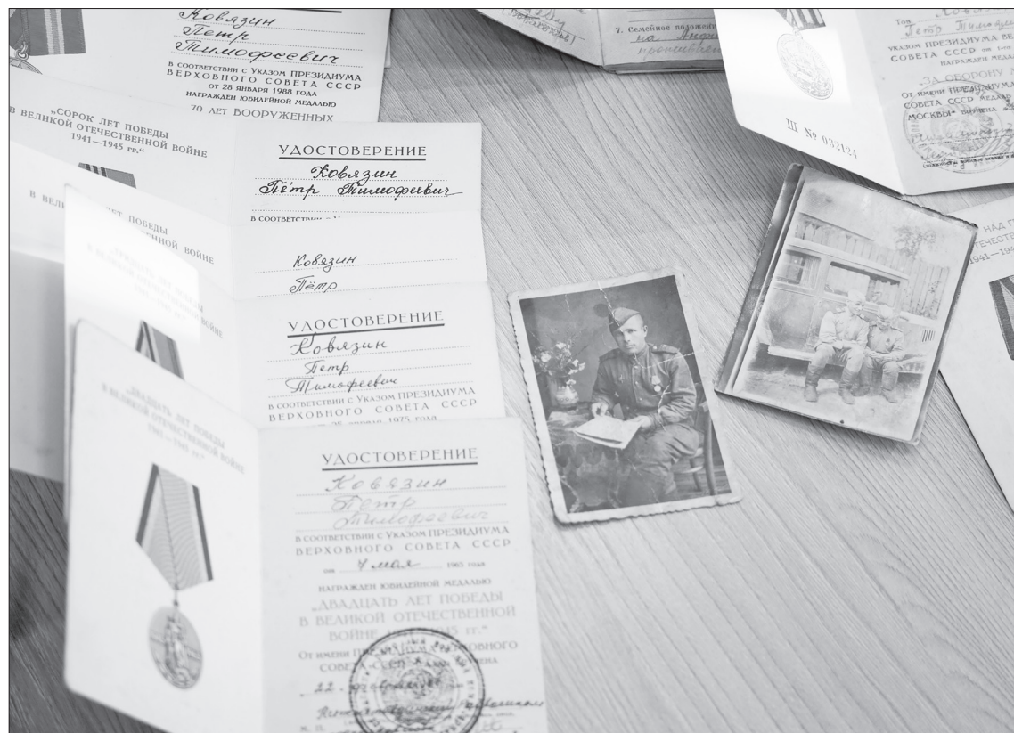
■ Пожелтевшие фотоснимки и ветхие удостоверения при внесении сведений в Книгу памяти оцифровываются. Так данные из них точно сохранятся на века.