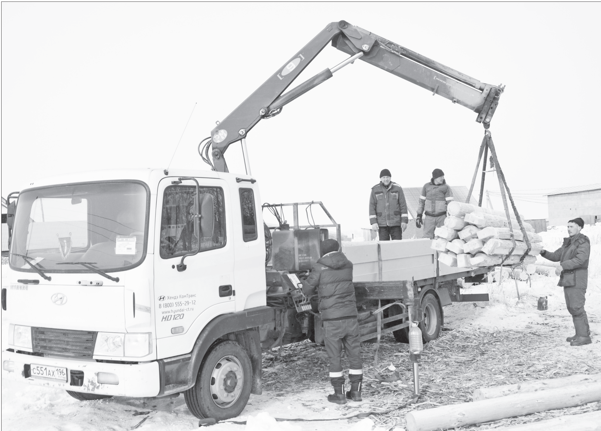
📷 Погрузка сруба для бойцов, участвующих в специальной военной операции, идёт полным ходом.

Работники станции Картымской изготовили сруб для нужд бойцов специальной военной операции