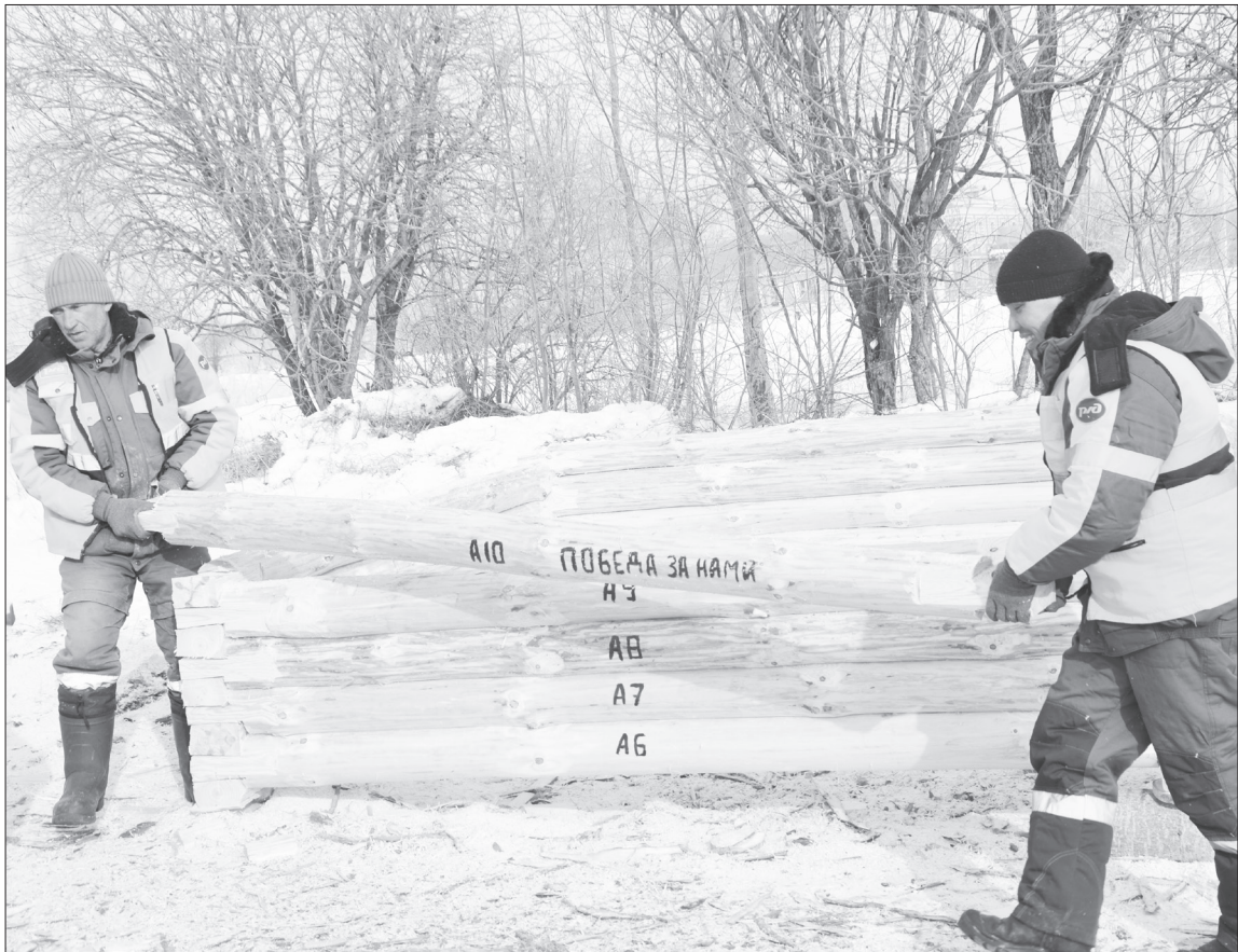
На одном из брёвен красуется надпись: «Победа за нами!».

В добрый путь! На 7 марта назначили отправку. Владимир Александрович в на-