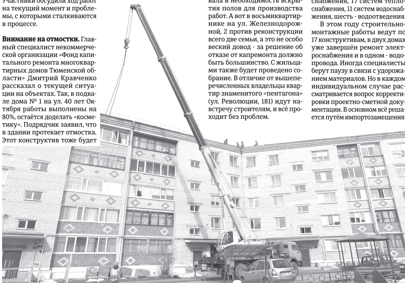
В самом разгаре замена кровли пятиэтажки на ул. Революции, 181

В этом году строительно-монтажные работы ведут по 17 конструктивам, в двух домах уже завершён ремонт электроснабжения и в одном - водопровода. Иногда специалисты берут паузу в связи с удорожанием материалов. Но в каждом индивидуальном случае рассматривается вопрос корректировки проектно-сметной документации. В основном всё решается путём импортозамещения.