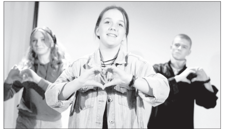
Дети в восторге от того, что происходит летом в «молодёжке»

сдадут экзамены и получат сертификаты. За лето они поработают с семью сотнями детей! Потому что кроме лагеря на базе МСДЦ действуют четыре дневных досуговых площадки по месту жительства, три из них – в дворовых клубах. Ну а в лагере ребята обеспечены полноценным трёхразовым питанием, медобслуживанием и вниманием вожатых. Многие из них – старшеклассники, а значит, на одной волне с отрядами. Но взрослые тоже присматривают, не без этого. Каждая смена имеет свою тематику и на полную использует современные технологии «молодёжки», в том числе виртуальную реальность. Но куда важнее находить новых друзей, узнавать родной город и раскрывать в себе неожиданные таланты. Кто-то блеснёт лидерскими качествами, а кто-то обнаружит невероятную склон-