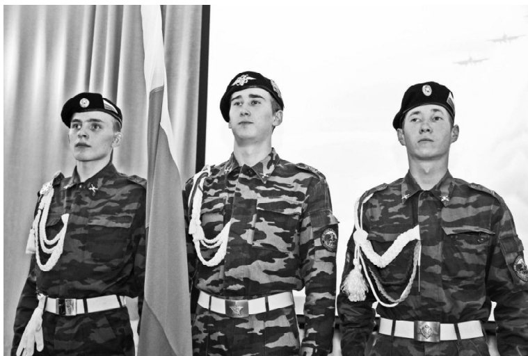
Федерации, звучит гимн... Собранных призывников А. Лап-

В торжественной обстановке открывается праздник — ребята военизированного класса вносят в зал флаг Российской