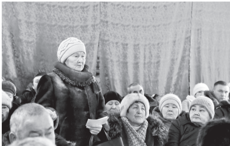
Вопрос от жительницы Аксурского поселения

В них в настоящее время зарегистрировано 436 человек, по факту проживает 262 человека. Как отметил Азат Камсуллоевич, отследившая динамику за последние пять лет, можно сделать вывод, что количество населения снизилось почти на 100 человек. Это связано и с уменьшением рождаемости. Например, в 2023 году в поселении не рождались дети, а умерло 9 человек. Также на убыль населения влияют переезды граждан. Детей до 18 лет в настоящее время зарегистрировано 83, работающих в организациях – 45 человек, работающих за пределами поселения – 60, вахтовым методом – 20 человек, студентов – 11, граждан пенсионного возраста – 102, инвалидов – 26. На территории поселения четыре многодетные семьи, в которых воспитываются 15 детей.