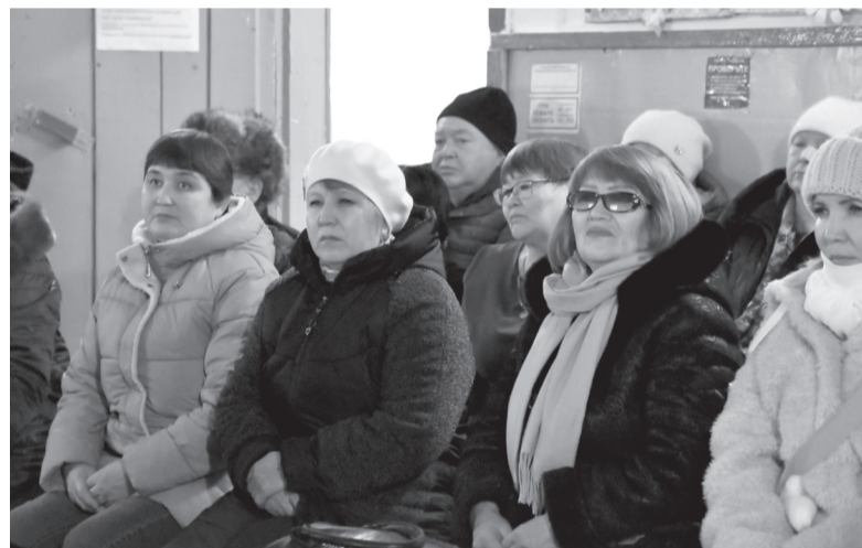
Жители Карагайского поселения также собрались на сход

В состав Карагайского сельского поселения входят пять населенных пунктов: село Большой Карагай, деревни Абаул, Ишаирская, Еланская и Тамбурыны. На территории числятся 264 хозяйства, в которых проживают 785 человек. В 2023 году родился один ребенок,