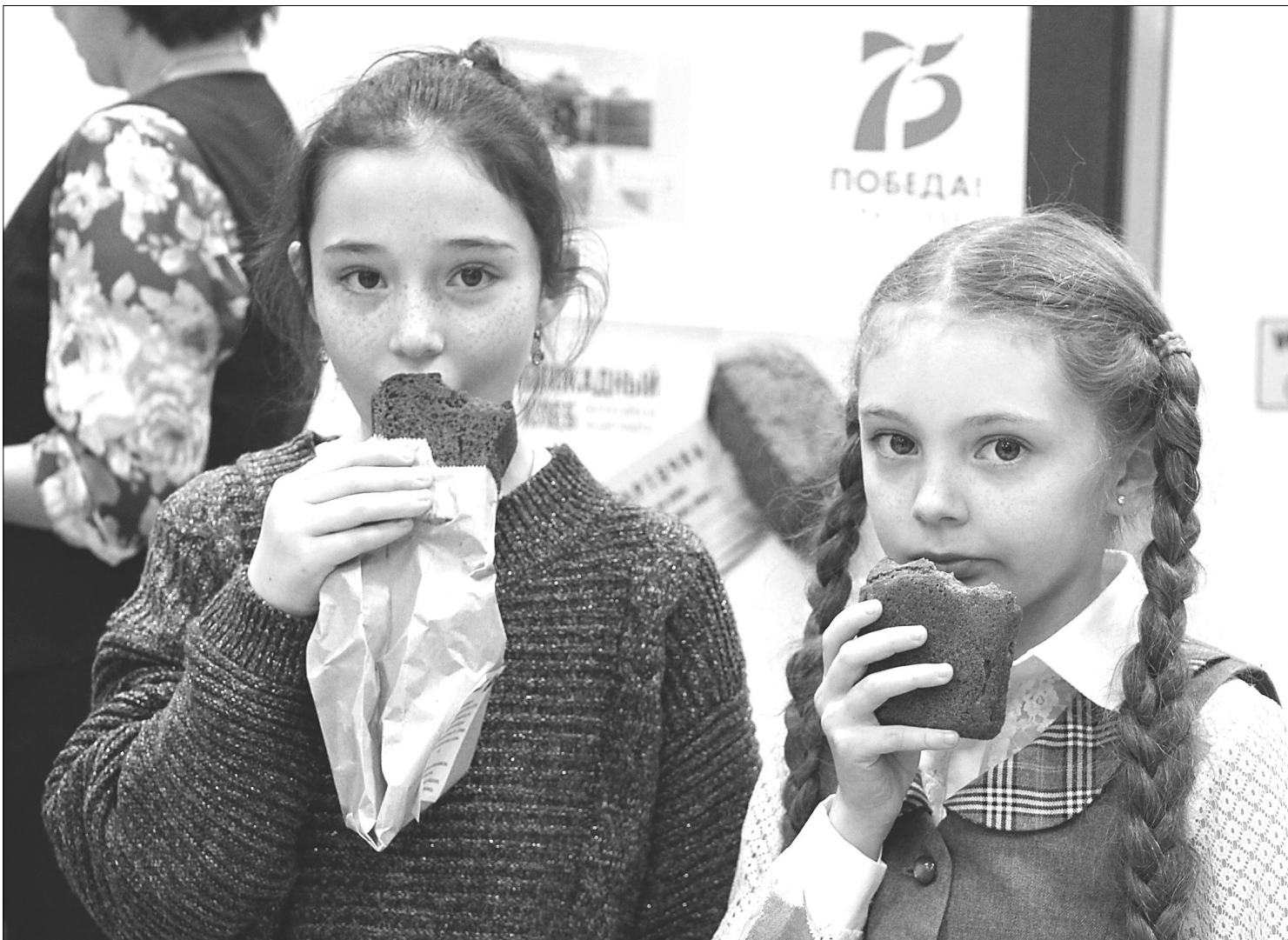
Во время проведения акции «Блокадный хлеб» современные дети смогли представить, как их ровесники в осаждённом Ленинграде получали паёк – 125 граммов в сутки

1945–2020 ЕСТЬ НОВОСТЬ? ПИШИТЕ, ЗВОНИТЕ: ☎ 8-(34546)-2-50-34 @ GOL_VESTNIK@MAIL.RU