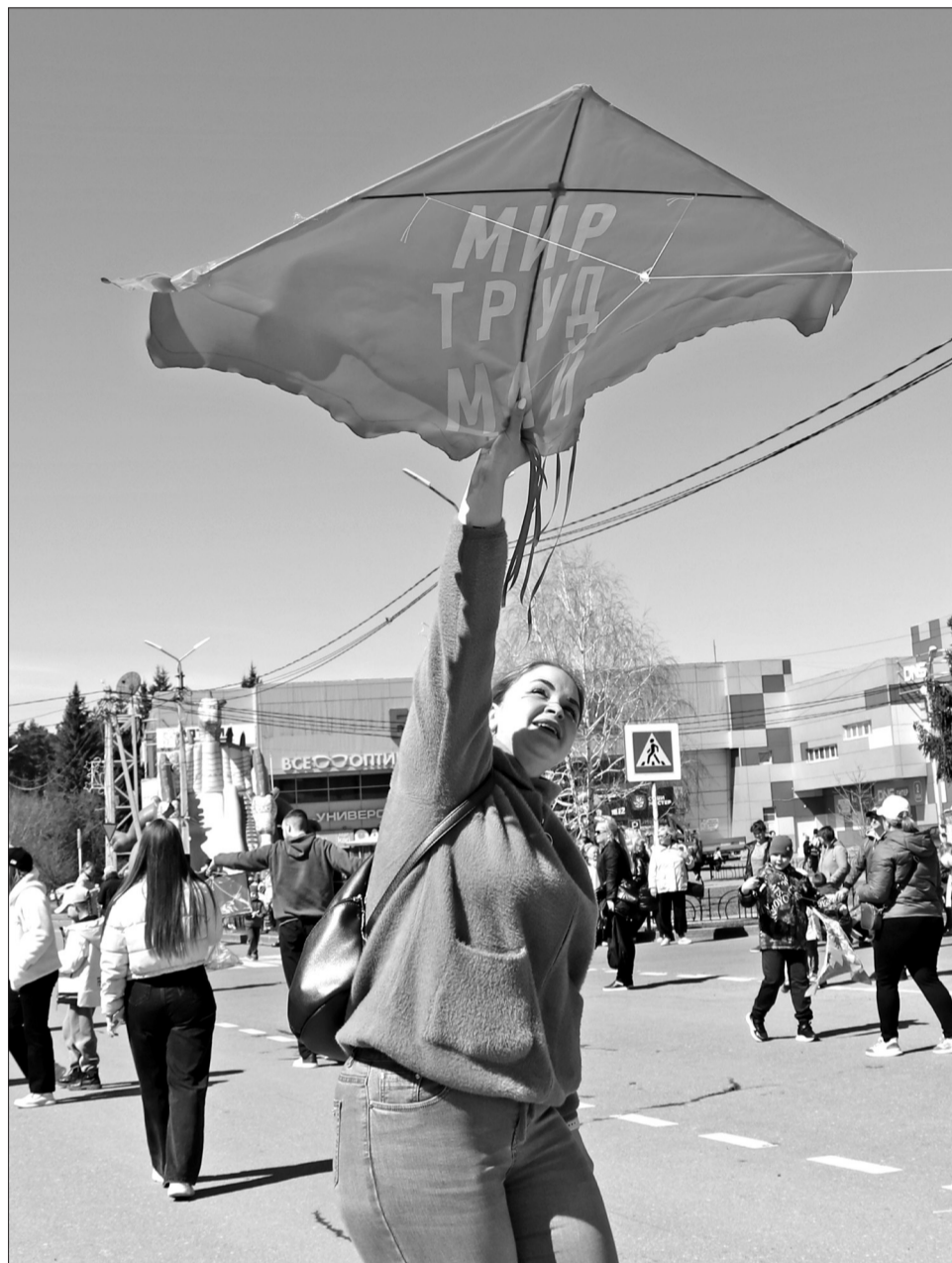
Небо, ветер, яркие эмоции – всё это окружной фестиваль «Крылья Сибири. Змей», который пройдёт в городе 1 Мая.