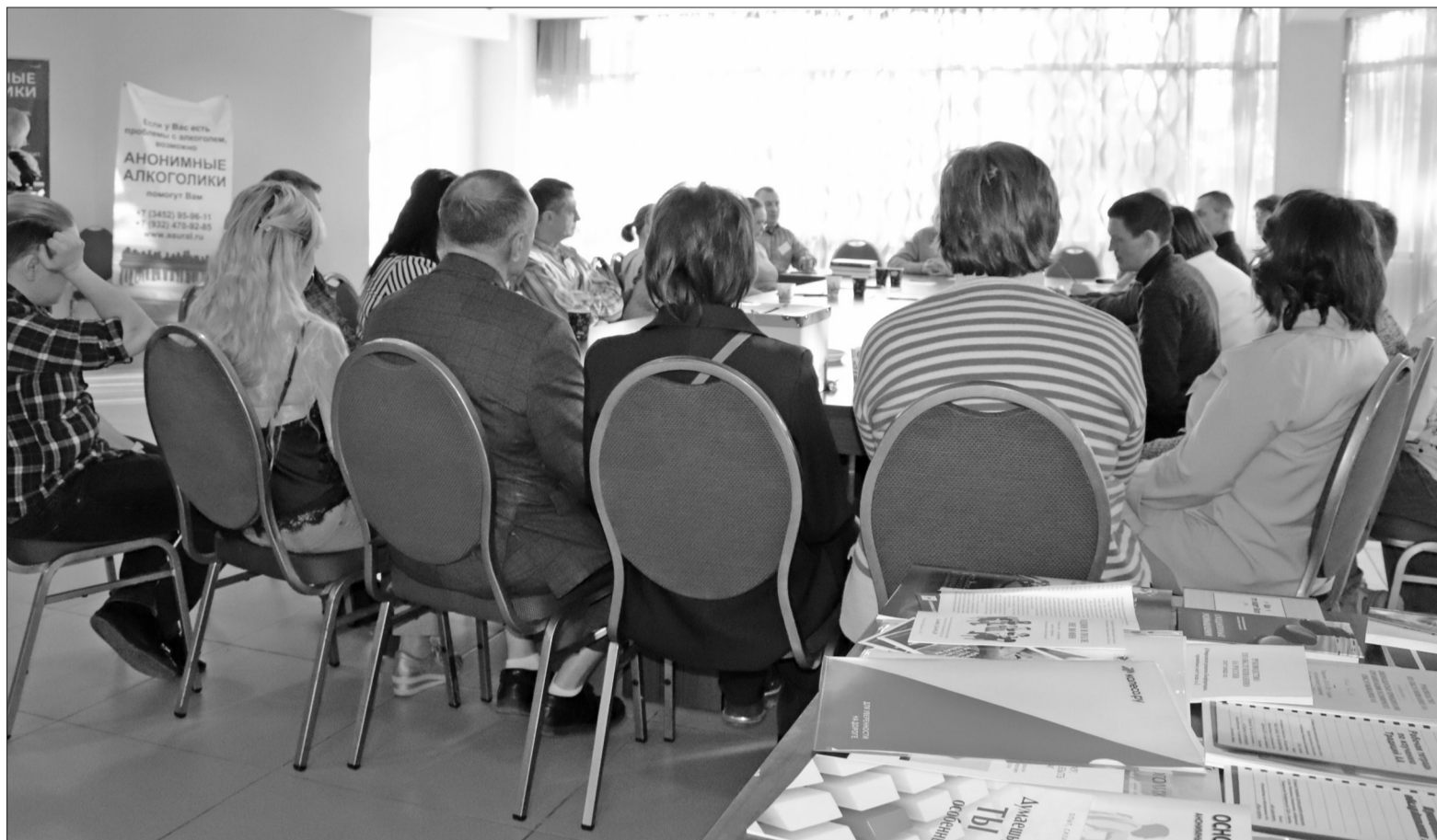
Люди, страдающие от алкогольной зависимости и желающие исцелиться от неё, находят поддержку в сообществе «Анонимные алкоголики» Тюменской области. На одной из встреч в Заводоуковске они решали насущные вопросы.

– Я ходила во Дворец культуры, что в центре города, и плела маскировочные сети. Но, к сожалению, возраст уже не тот – ноги болят. Потом узнала, что знакомая вяжет носки и отвозит их в ДК «Ритм», где волонтеры формируют гуманитарный груз. А я решила купить несколько противодроновых одеял. Теперь делаю это каждый месяц. Таков мой маленький вклад в победу. Надеюсь, что это спасёт чью-то жизнь и станет примером для других, – завершает разговор горожанка.