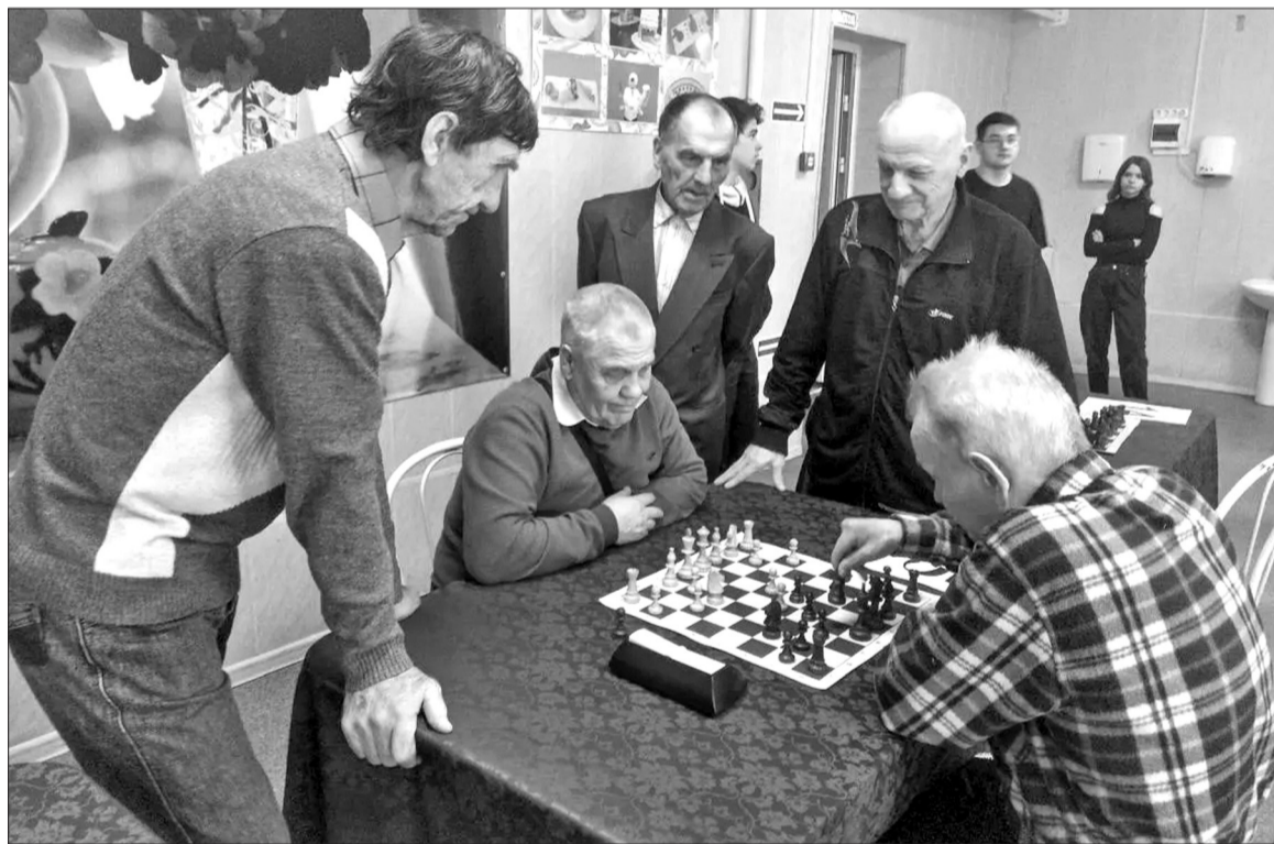
Ещё до начала турнира шахматисты с удовольствием сыграли партию в качестве разминки.

Инициатива нашла поддержку у других любителей шахмат, а площадку для турнира гостеприимно предоставило Заводоуковское отделение агротехнологического колледжа.