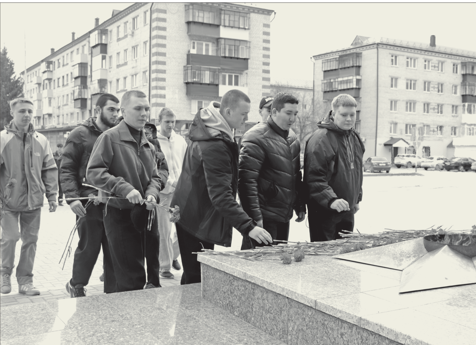
В знак преемственности поколений: призывники Заводоуковского муниципального округа возложили цветы к городскому мемориалу Памяти на привокзальной площади.

Весенний призыв. Заводоуковские призывники готовы пройти армейскую школу жизни