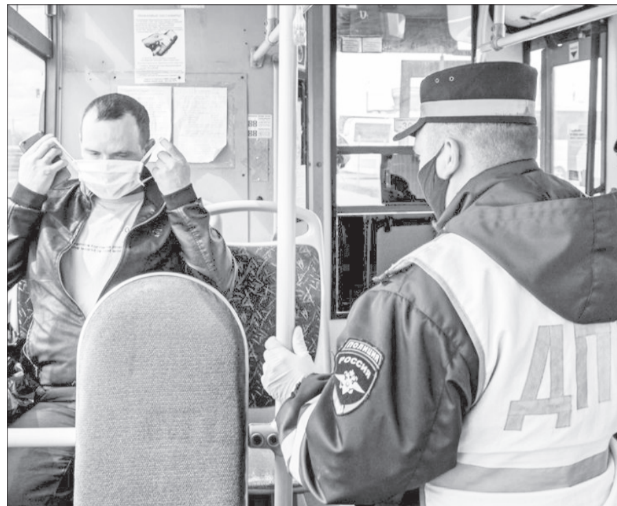
Цель полицейских не сбор штрафов, а контроль за соблюдением режима повышенной готовности