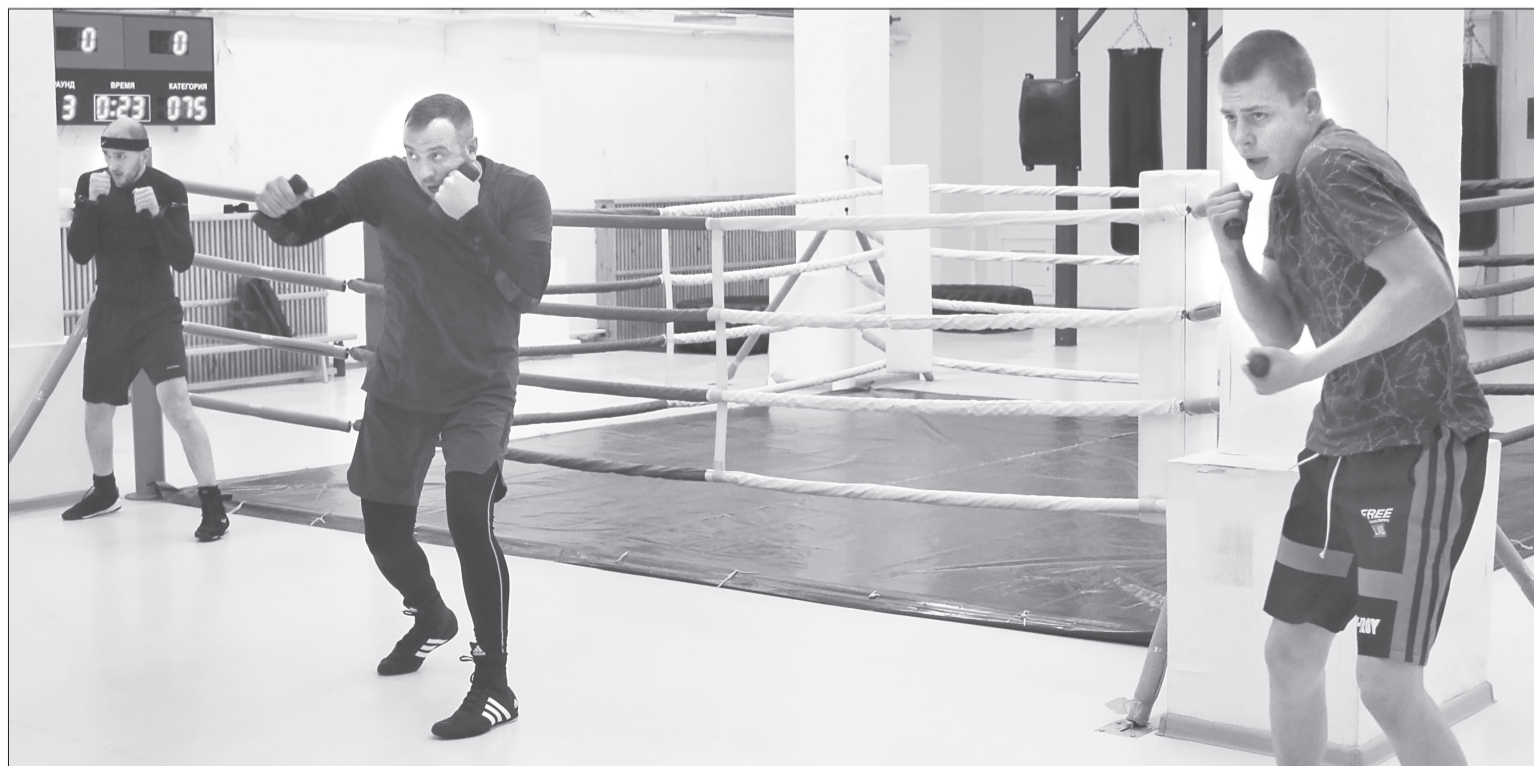
Больше всех, кажется, возобновлению тренировок рады спортсмены. В СК «Атлант» открыты все секции и залы

Продолжили свою работу в привычном виде социальные ориентированные некоммерческие организации, частные студии и группы. Так, например, с понедельника начались танцевальные занятия в КДЦ «Юбилейный», а в ближайшие выходные там вновь соберутся на брейк-данс. При этом во всех случаях соблюдение санитарных норм и ограничений остаётся обязательным, а руководством к выполнению являются решения областного оперативного штаба.