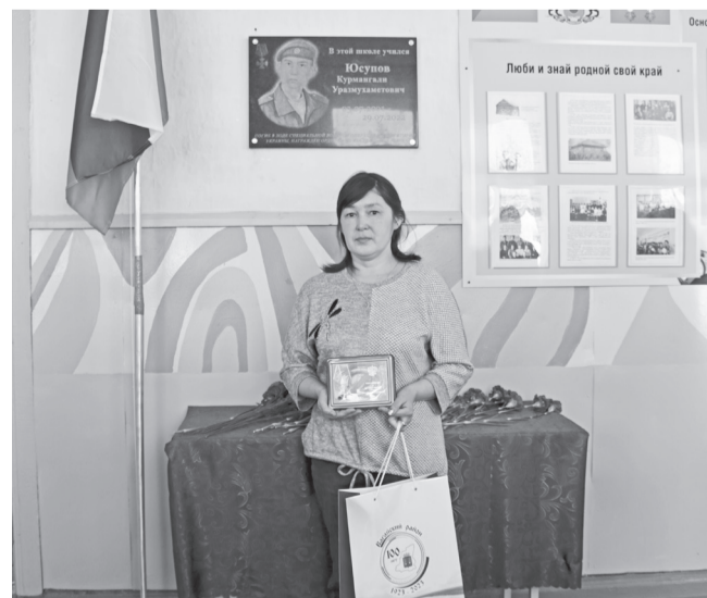
Мать героя Ю.Б. Юсупова