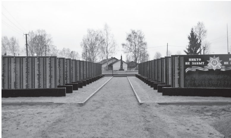
Воинское кладбище в Новой Деревне Парфинского района