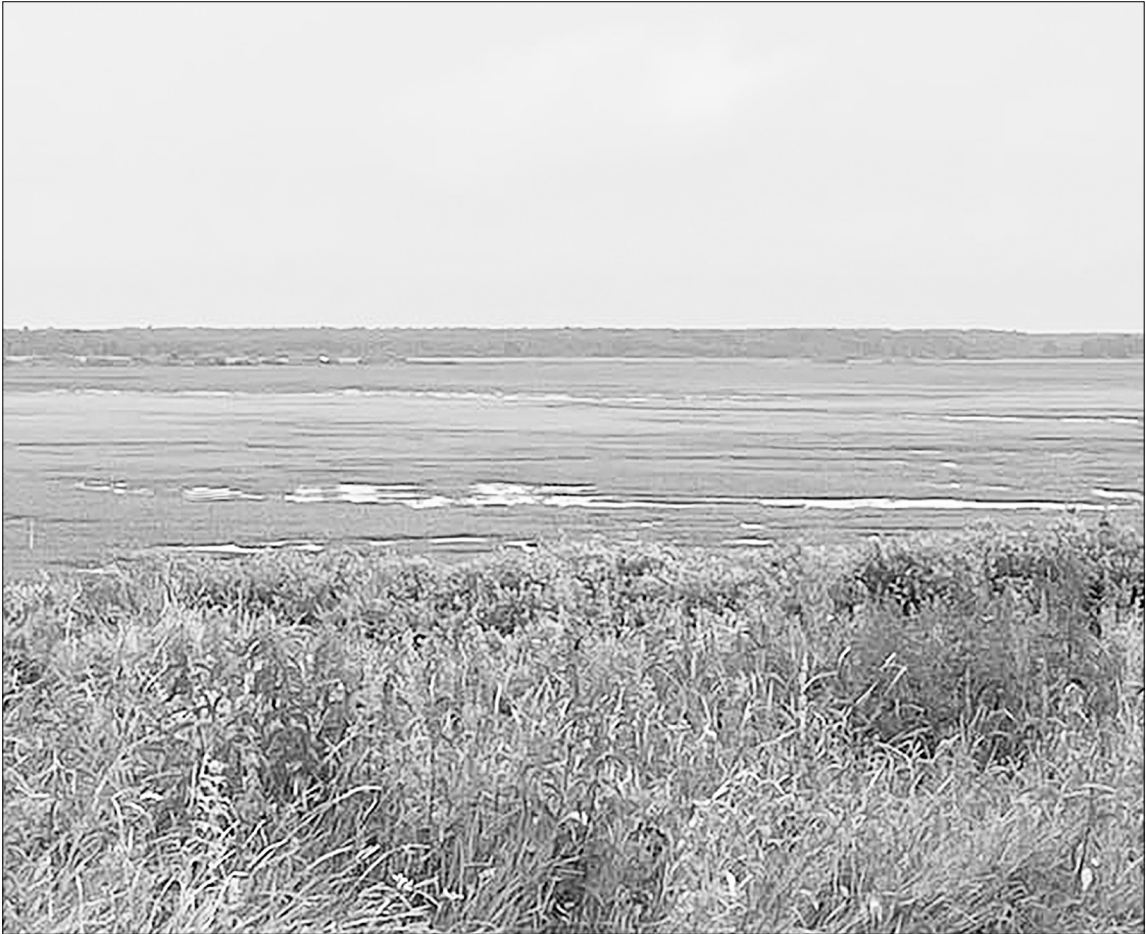
■ Заросшее озеро Среднее Тарманское.

– Татары испокон веков селились возле озёр, рыбачили, охотились, добывали пищу, этим и жили в основном. Местное население само занималось озером на свои материальные средства, оставливали воду, закрывали утечки. И вода не уходила в прилегающие болота. Всё делали вручную. Старшее поколение заботилось об озёрах. В последнее время в Большом озере вода выше, чем в Среднем, между ними проложена труба. Весной её открывали, потом закрывали, чтобы вода не слишком высоко была. А когда торфяники начали работать, из озера сделали пожарный водоём. Когда эколо-