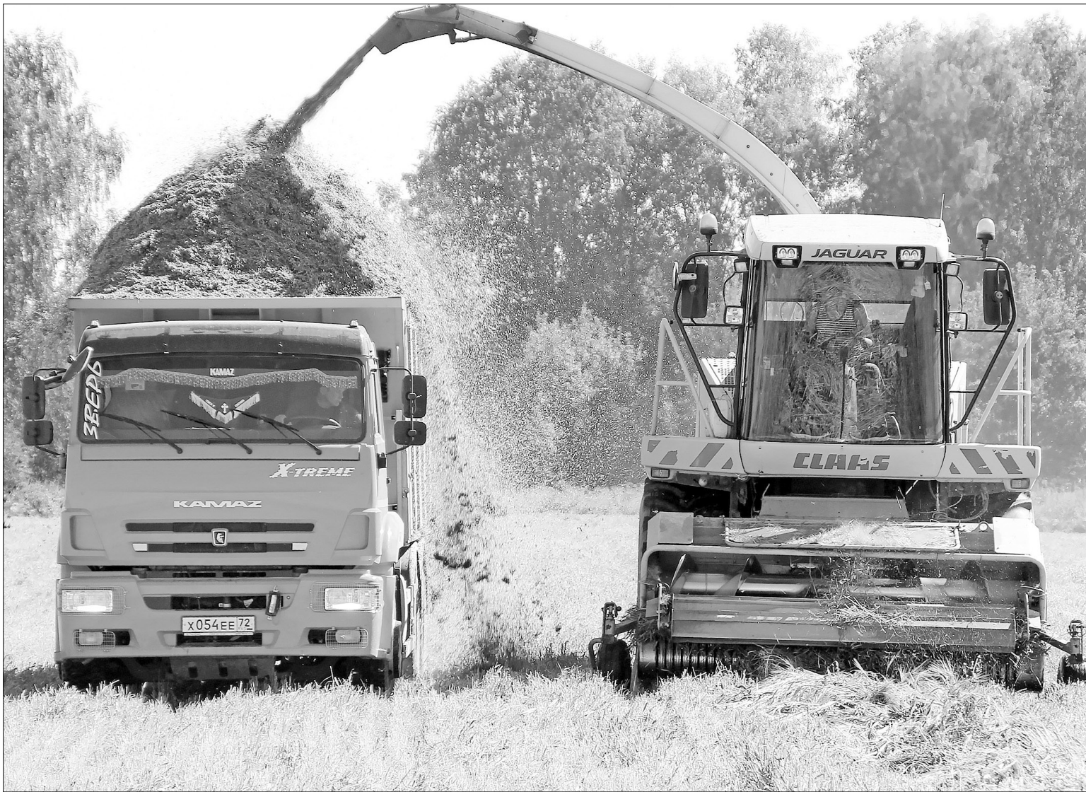
Красота да и только! Процесс заготовки идёт как по маслу. Коровы будут рады свежему корму!