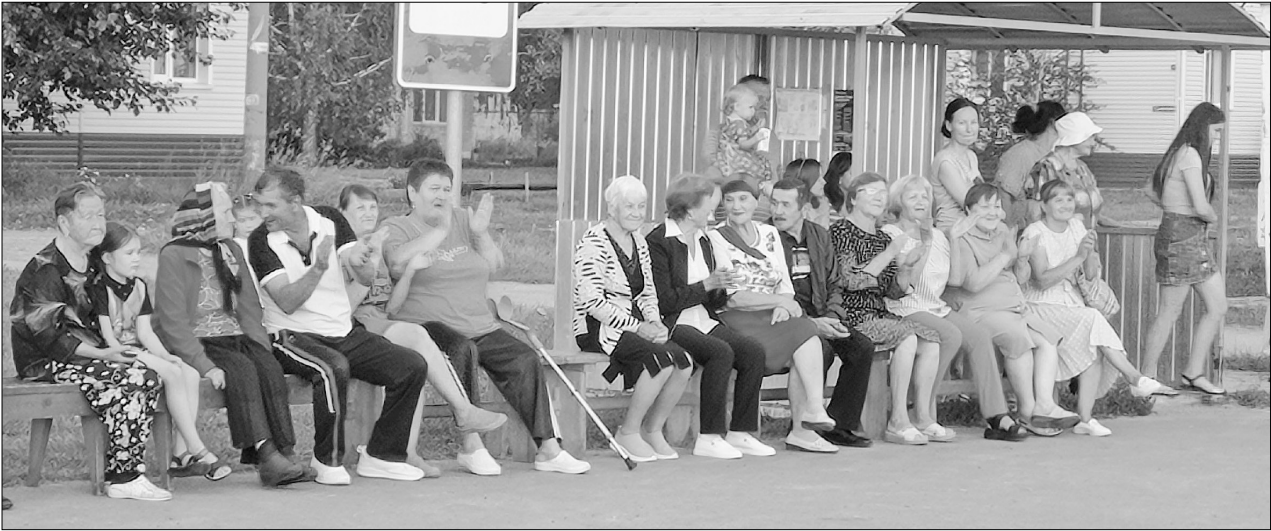
Жители станции Картымской тепло отреагировали на концертные номера, подготовленные работниками автономного учреждения «Культура».

6 августа в посёлке Картымском отметили день железнодорожника