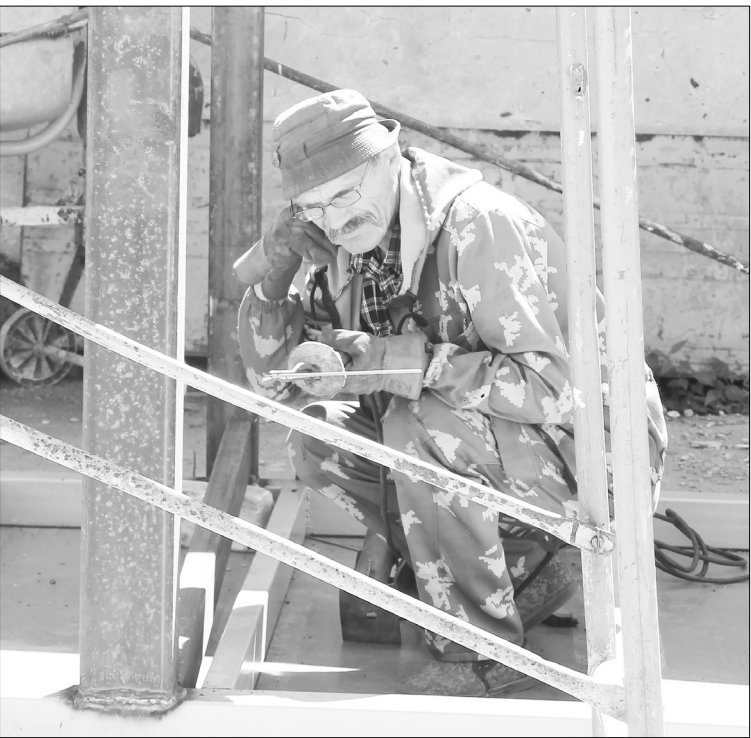
По секрету всему свету: идёт монтаж общественных туалетов, которые скоро появятся на улицах села.