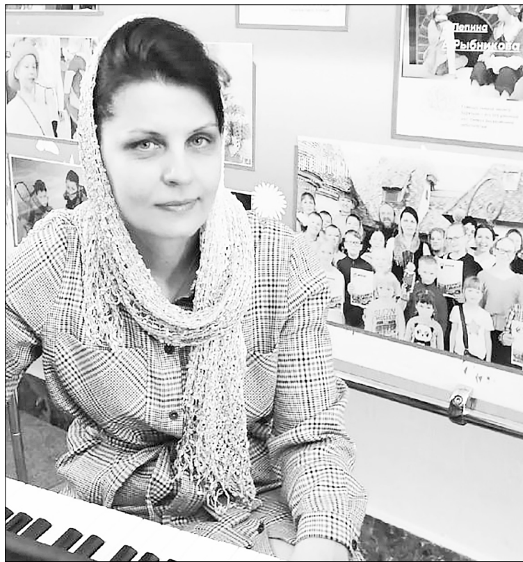
Ольга Викторовна за главным инструментом её жизни.