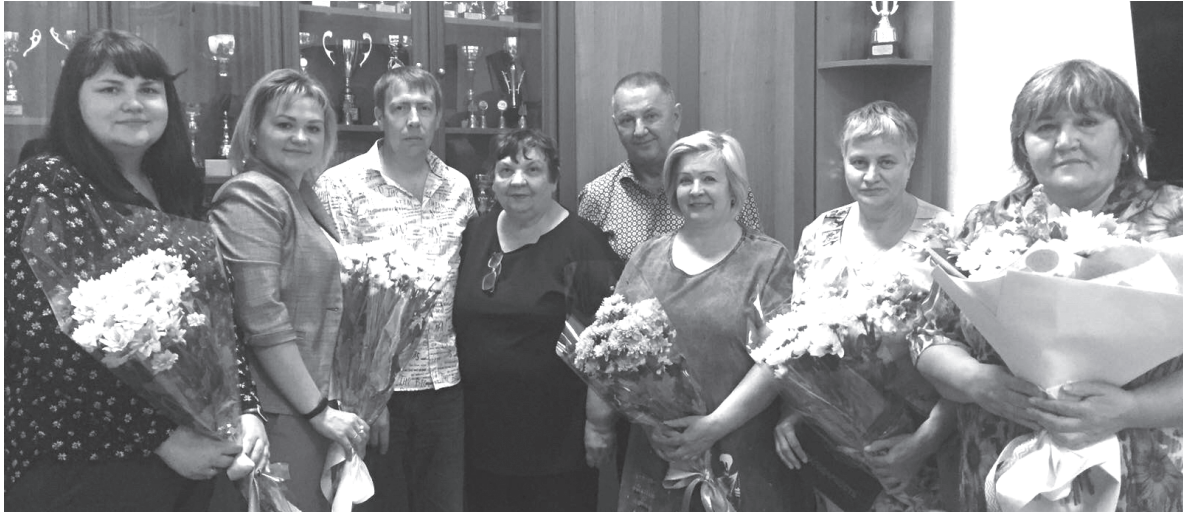
Актив избирательного округа

Нефтехимическая отрасль уже достаточно хорошо авто-