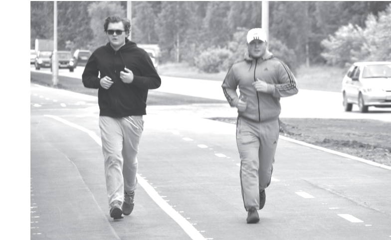
Бег в удовольствие

18-летние любители бега (кстати, один из них мастер спорта по пауэрлифтингу) ежедневно пробегают по пять километров: половину – в утренние часы, половину – вечером. Говорят, что это помогает им поддерживать хорошую физическую форму и даёт бодрость на весь день.