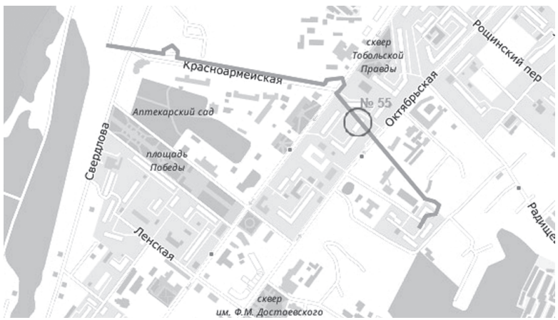
Фундамент пятиэтажки заложили по краю засыпанного рва

Таким образом, предполагает учёный-археолог, если бы проектировщики дома и в дальнейшем строители обратили внимание на эту историческую данность, возможно, он бы до сих пор стоял на своем месте. Вместе с тем Евгений Загваздин отмечает, что подобные строительные огрехи в Тобольске уже случались и ранее. Чтобы не быть голословным, он называет археологические раскопки исторического рва XVII века, проходившие в 2003 году под руководством тобольского историка Алексея Нескорова на территории Тюремного замка. В результате проведённых исследований было установлено, что ров позднее также был перекрыт фундаментами зданий. И из-за рыхлого заполнения пустот (кто бы мог подумать – слежавшимся навозом!) произошла неравномерная усадка фундамента и появились трещины в стенах бывшего каторжного здания.