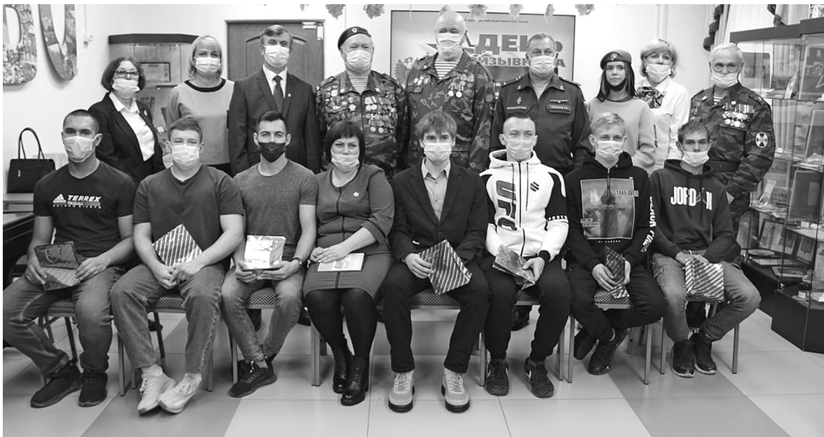
Торжественные проводы призывников на службу – добрая традиция в Голышмановском округе. 28 октября в краеведческом музее на мероприятие собрались военнослужащие разных поколений

В октябре начался осенний призыв в ряды Вооружённых сил. По доброй традиции, в краеведческом музее торжественно проводили ребят в армию. В связи с пандемией, программа прошла с соблюдением всех мер безопасности.