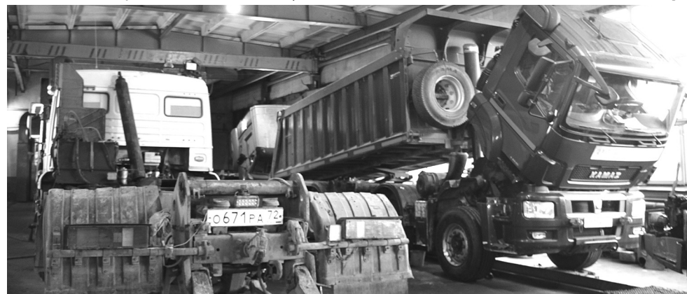
Сердце предприятия – ремонтные мастерские, здесь починят и даже дадут вторую жизнь любому транспортному средству. Кроме собственной техники, ремонтируют школьные автобусы, технику птицефабрики «РУСКОМ», ООО «Горизонт»