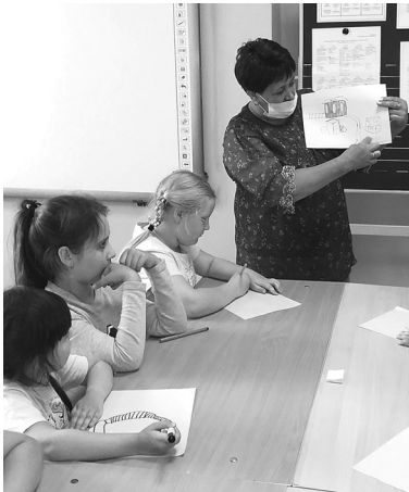
Инициативная группа в начале реализации проекта

Такой проект реализовывает инициативная группа школы № 2 в рамках конкурса профилактических проектов «Вплощай идеи в жизнь».