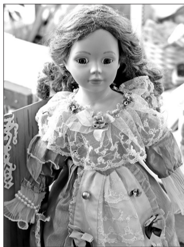
Коллекционер возвращает к жизни не только старые игрушки, но и от современных красавиц не отказывается.

– В 2021 году я и извлекла на свет своё кукольное «наследство», которое долгое время хранила в чемоданах. Говорила себе, что игрушки привожу в порядок для Маши, – улыбается