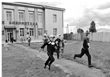
земляка (родился в деревне Безруково Ишимского района),

В течение четырёх месяцев текущего года работники Сорокинской районной библиотеки провели немало интересных мероприятий, посвящённых 200-летию со дня рождения нашего