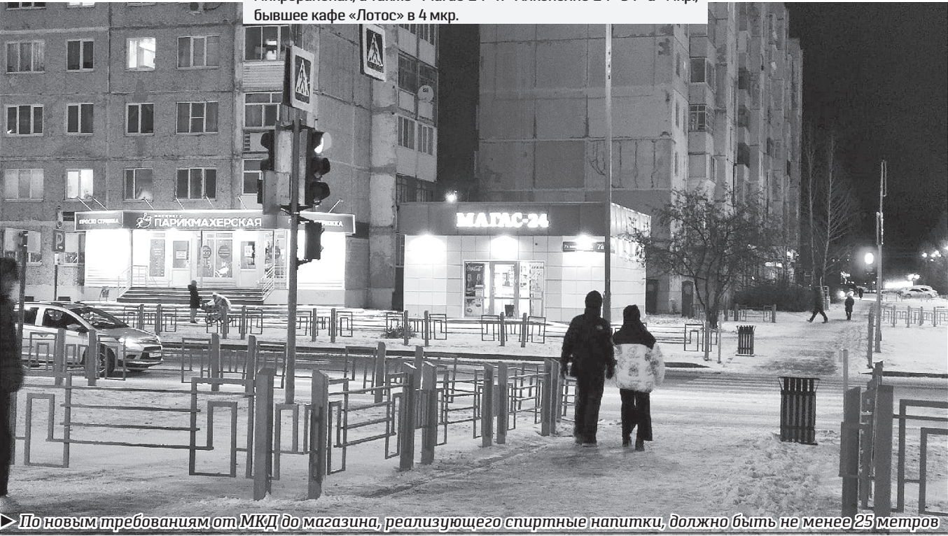
По новым требованиям от МКД до магазина, реализующего спиртные напитки, должно быть не менее 25 метров

В результате при утверждении данного НПА 13 объектов потребительского рынка попадают в границы запрета: это кулинария в 7 мкр., три бара «Впиве» в 9 мкр. и в Менделеево, пять магазинов «Светлое и тёмное» в Иртышском, 10, 6 и 4 микрорайонах, а также «Магас-24» и «Алкополис-24» в 7»а мкр., бывшее кафе «Лотос» в 4 мкр.