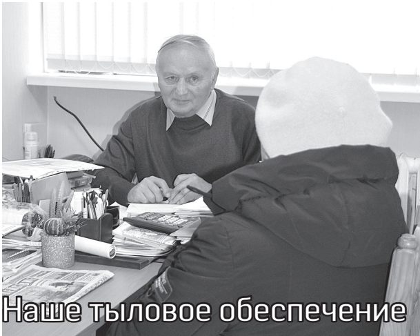
Наше тыловое обеспечение