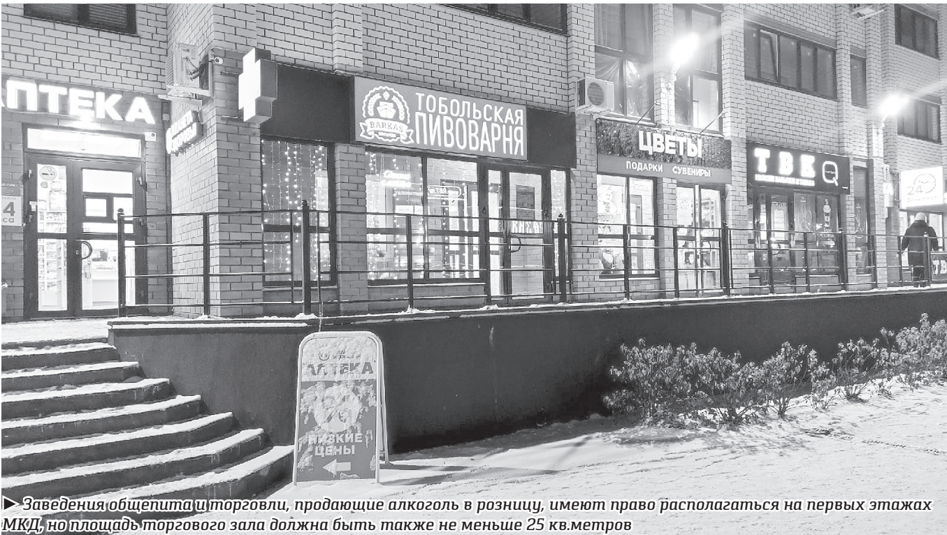
Заведения общепита и торговли, продающие алкоголь в розницу, имеют право располагаться на первых этажах МКД, но площадь торгового зала должна быть также не меньше 25 кв.метров

Новый проект НПА по установлению границ запрета продажи алкоголя был единогласно поддержан всеми членами спецкомиссии. В ноябре пройдут общественное обсуждение проекта и правовая экспертиза НПА прокуратурой города