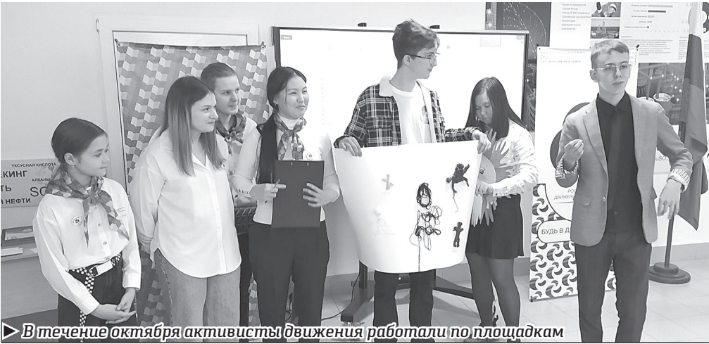
▶ В течение октября активисты движения работали по площадкам