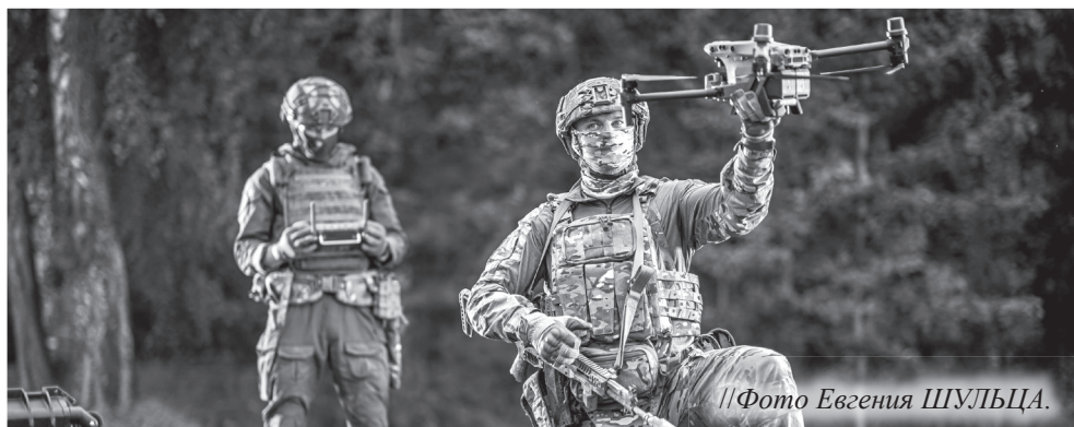
//Фото Евгения ШУЛЬЦА.

Информационный центр правительства Тюменской области.