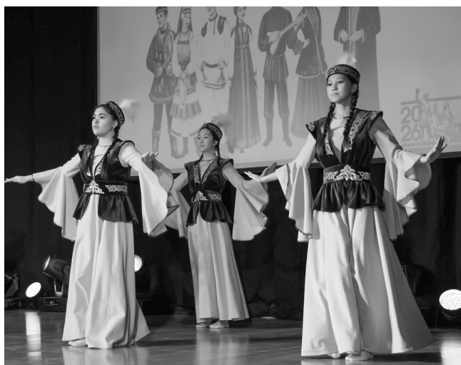
Традиция – объявлять тематические годы по указу президента Владимира Путина – способствует привлечению внимания общества к важным вопросам. Тема единства народов России актуальна во все времена.