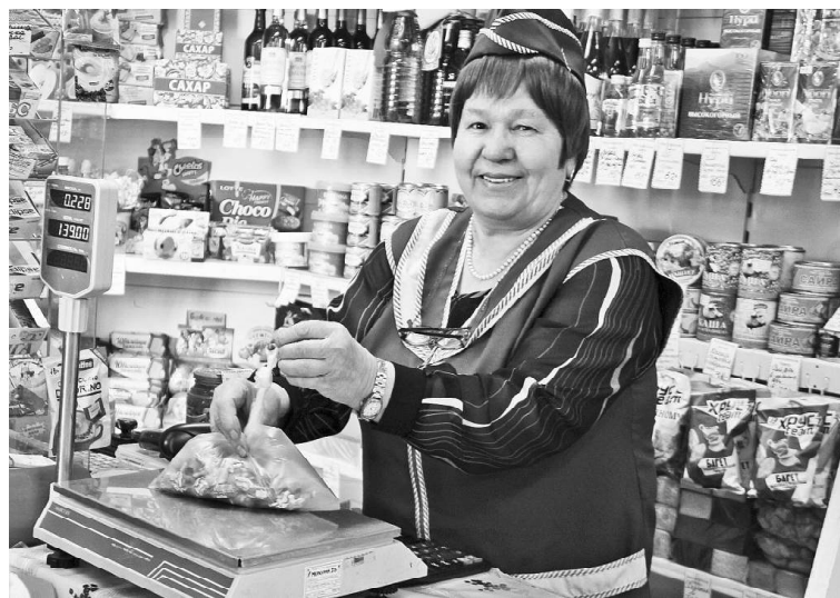
➤ Галина Назарова

Трудилась Галина во всех промышленных и продовольственных торговых точках райцентра: и в универсаме, и в культтоварах, и в гастрономе, и в магазинах