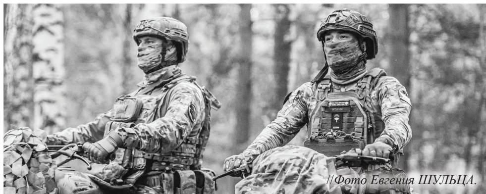
//Фото Евгения ШУЛЬЦА.

Информационный центр правительства Тюменской области.