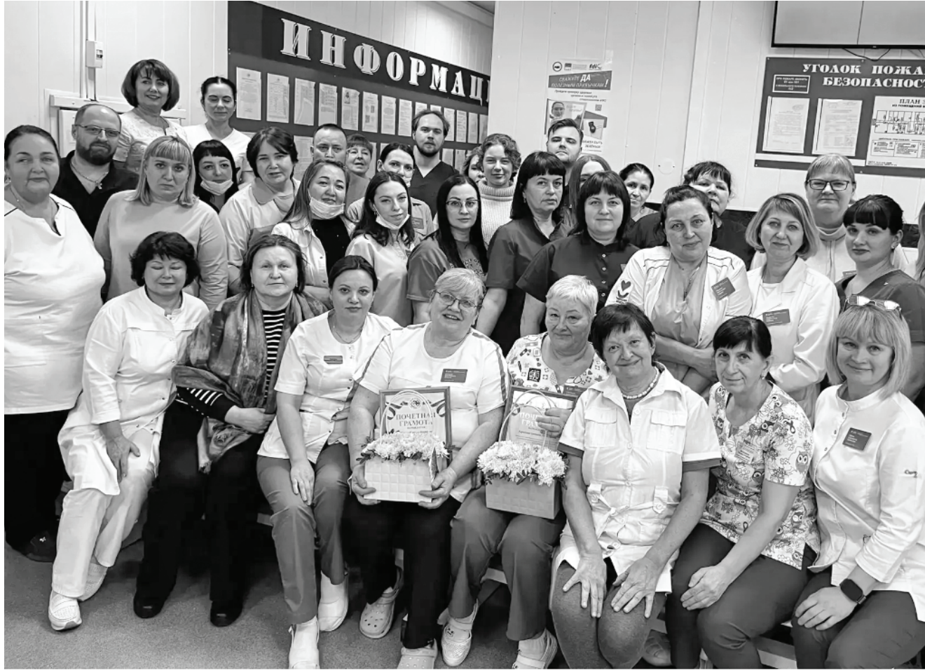
В ишимской стоматологии трудится большой и дружный коллектив.