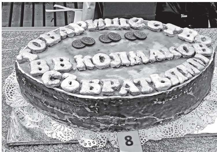
• Украшение конкурса-выставки «Кулинарный профи» – огромный пряник в виде печати товарищества братьев Колмаковых. Её оригинал хранится в Заводоуковском краеведческом музее.