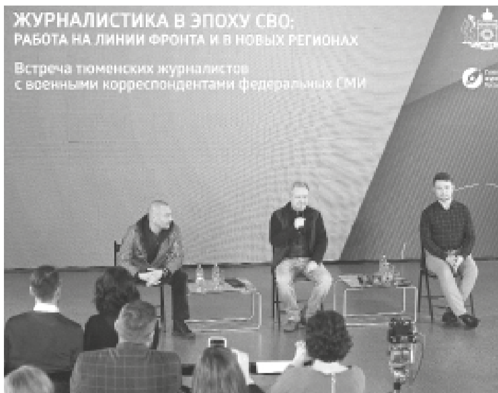
ЖУРНАЛИСТИКА В ЭПОХУ СВО: РАБОТА НА ЛИНИИ ФРОНТА И В НОВЫХ РЕГИОНАХ Встреча тюменских журналистов с военными корреспондентами федеральных СМИ

– Это время героев, – сказал губернатор, – время гордости, сопричастности, защиты общества, русского языка, нашей идентичности и сохранения суверенитета великой России. По мнению Александра Моора, местом сражения сегодня являются и новые территории России, и, безусловно, информационное пространство. Вопросы качества работы медиа, возвращения к журналистике факта важны не только для