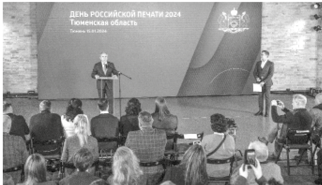
ДЕНЬ РОССИЙСКОЙ ПЕЧАТИ 2024 Тюменская область Тюмень 18.01.2024

профессионального сообщества, но и для общества в целом. Речь идёт о сохранении стабильности и процветания страны, поэтому к работникам СМИ появились особые требования – к их компетентности, ответственности и профессионализму.