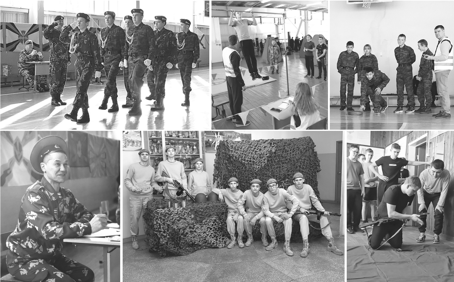
В спортивно-оздоровительном комплексе агропедколледжа допризывники испытали силы в четырёх видах состязаний, которые подготовили сотрудники Голышмановского молодёжного центра

Соревнования для будущих защитников Родины в нашем округе проводят уже около 20 лет