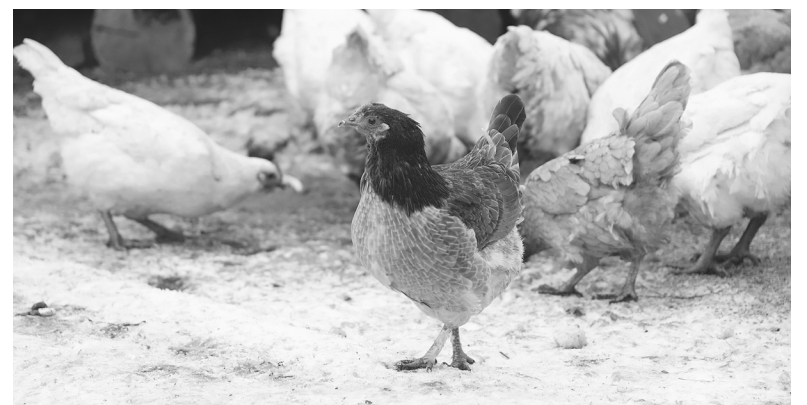
К опасному вирусу гриппа птиц восприимчивы все пернатые

Подготовила Наталья ГЛАДКОВСКАЯ