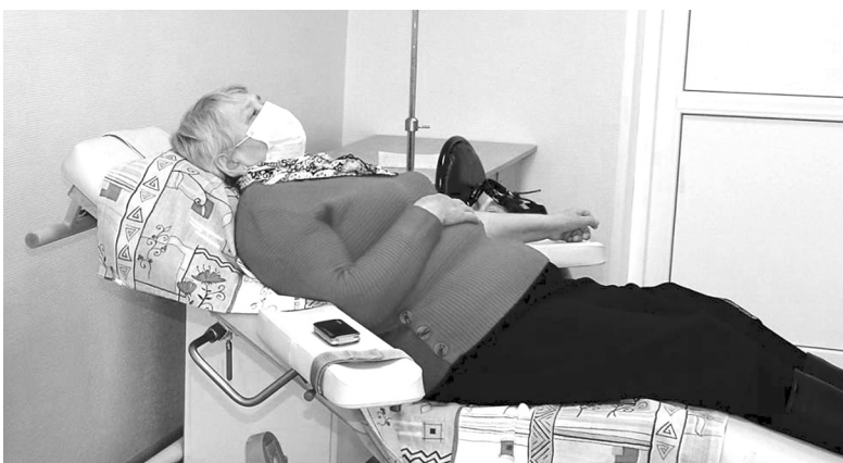
За 2023 год в дневном стационаре центра амбулаторной онкологической помощи провели больше 270 сеансов химиотерапии

Новое структурное подразделение Областной больницы № 11 находится на втором этаже местной поликлиники. Здесь обслуживают жителей не только нашего округа, но и Аромашевского, Омутинского и Юргинского районов. Общая численность населения в этих муниципалитетах – больше 60 тысяч человек.