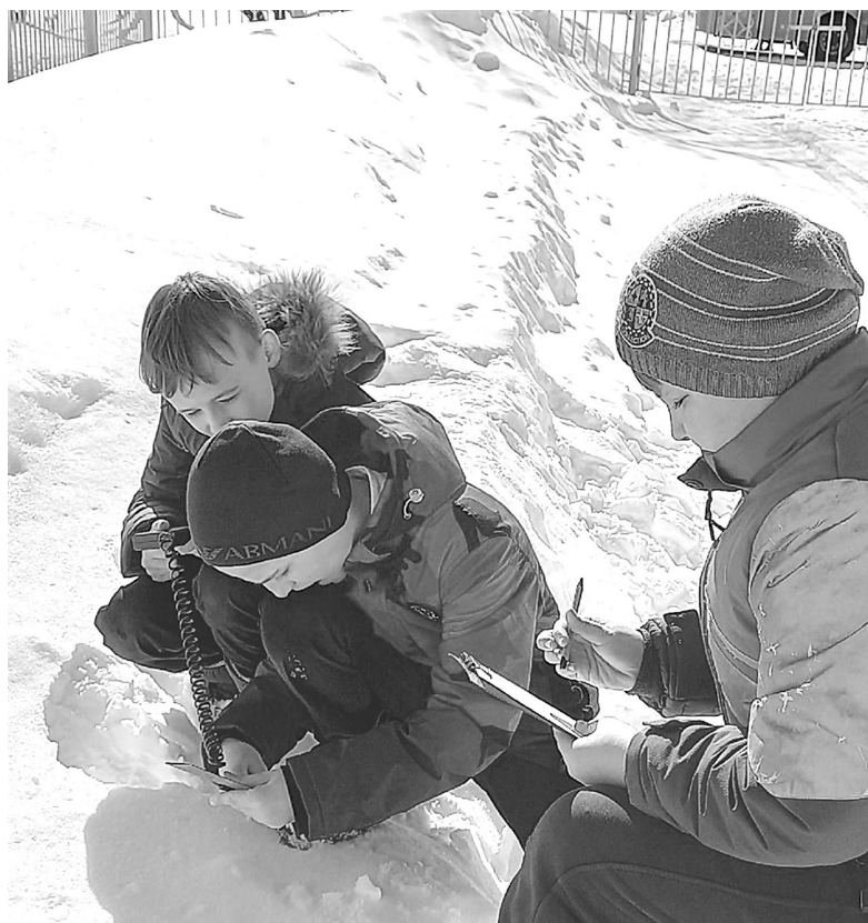
Ребята из объединения «Юный эколог» исследовали территорию школы № 1 посёлка Голышманово на загрязнённость автотранспортом. Выяснили, что она здесь есть, в отличие от территории школы № 4, расположенной не в центре

Надежда ЧЕРЕПАНОВА