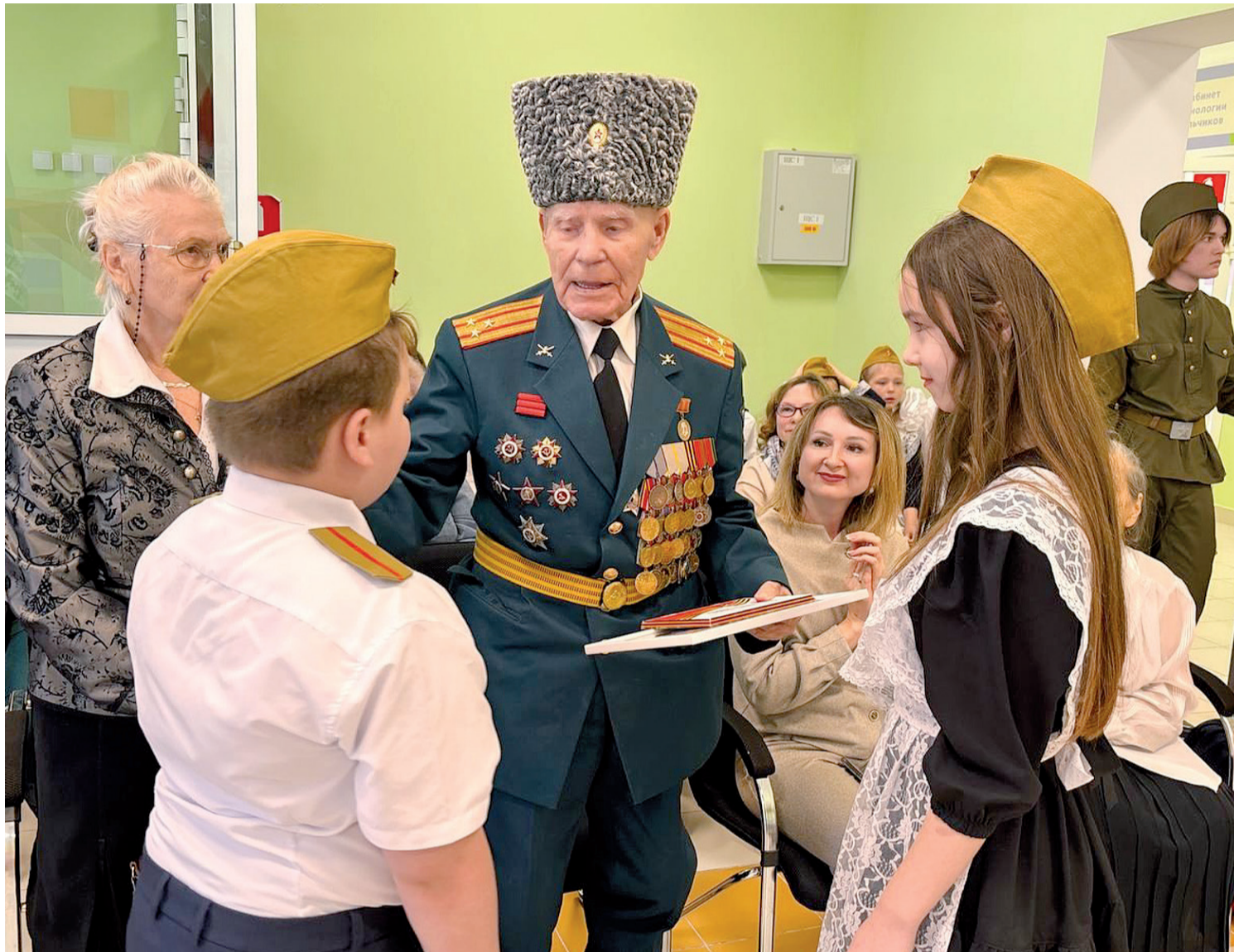
► Овсянниковская детвора приветствует легендарного земляка

Сегодня дело наших дедов доблестно продолжают участники специальной военной операции. Они с честью и мужеством отстаивают российские рубежи, а в тылу за них стоят наши волонтеры – люди с большим и добрым сердцем.