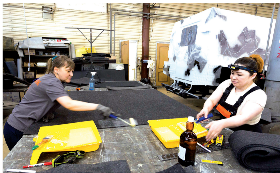
► Внутреннее оснащение машин

Пожалуй, это искусство – быть счастливым и видеть нужды других, не оскудеть душой, быть справедливым, честным и чутким – именно так характеризуют своего руководителя его сотрудники.