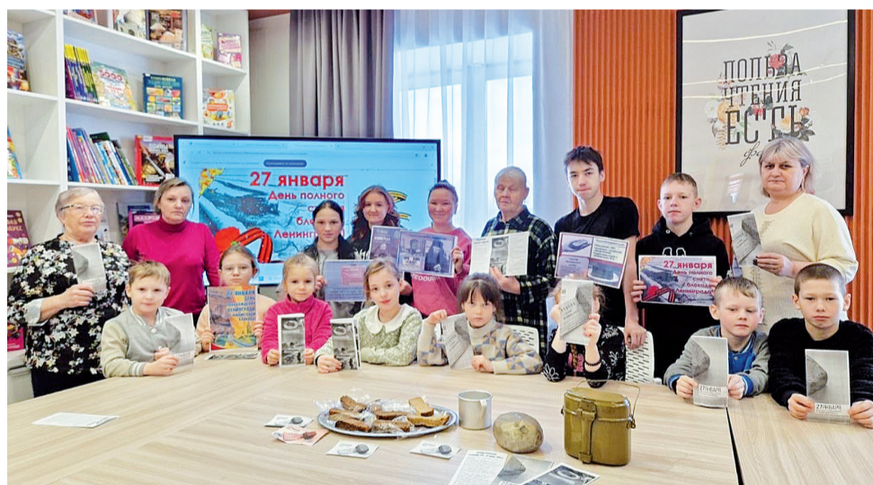
► Участники беседы «Подвиг ленинградцев» из Загваздиной

В Башковой активисты и волонтеры вышли на улицы и раздавали жителям символические кусочки «блокадного хлеба». А для учащихся начальной школы был проведён урок мужества «Мы помним ваш