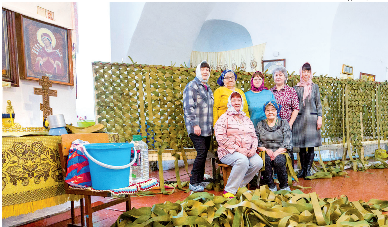
► Волонтеры из Булашово

– Дело-то богоугодное, – сказал он и благословил его. На первый взгляд храм и «благородное дело» несколько диссонируют, но стоит всмотреться в лица наших героинь и святые лики – и видишь, что они органичны, как и их помыслы. Плавные движения, приглушенные голоса – какой-то особый тон и работе, и беседе задаёт дух храма. Хочется говорить только о хорошем, верить в лучшее, как одна из участниц движения – молодая женщина, жена участника СВО, как мамы солдат, вплетающие с молитвой каждый фрагмент сети, ведущие каждую строчку швейных машин, на которых с прошлого года