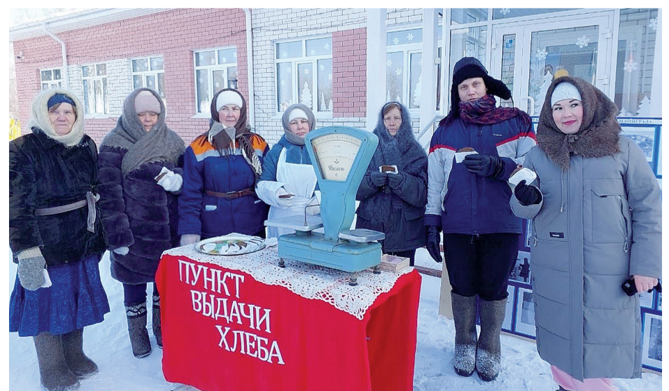
► Акция «Хлеб блокадного Ленинграда» в Малозоркальцевой

В рамках акции прошли также выставка рисунков «Блокадный Ленинград» в Санниково, акция «Блокадный хлеб» в Сетово, урок мужества и акция в Байкалово и других населённых пунктах.