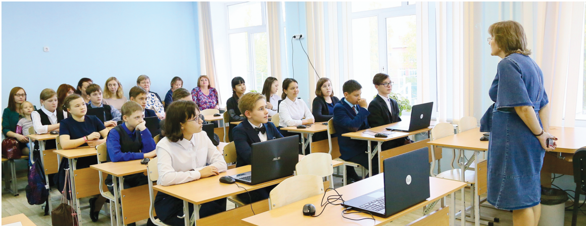
Тобольские школы не перейдут на онлайн-обучение

Как только на портале министерства просвещения России появился проект о проведении «в российских школах и колледжах эксперимента по внедрению цифровой образовательной среды», родители сразу стали писать в интернете о необходимости создать петицию против данного эксперимента. В пояснительной записке к документу сказано, что ЦОС – это совокупность условий для реализации образовательных программ с применением дистанционных образовательных технологий. И предусматривается проведение с 1 сентября 2020 года по 31 декабря 2022 года эксперимента по внедрению целевой модели цифровой образовательной среды. Новую систему планируют опробовать в 14 регионах страны, в том числе в Тюменской области. Тобольские родители, как и тюменцы, составляют петиции и выступают в соцсетях против пилотного проекта по дистанционному образованию своих детей. В редак-