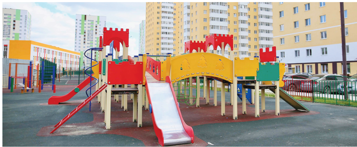
В Тобольске проверили безопасность 55 детских площадок

Кроме того, по словам заместителя главы города, в адрес управляющих компаний направляются информационные письма с разъяснениями об обязанности принятия мер по очистке детских площадок от снега, наледи, обеспечения порядка в летнее время. Депутаты сочли, что работа в данном направлении проводится регулярно и результаты налицо. Они также выразили надежду, что проводимая оценка позволит привести детские игровые площадки в нормативное состояние, что обезопасит детей от травматизма.