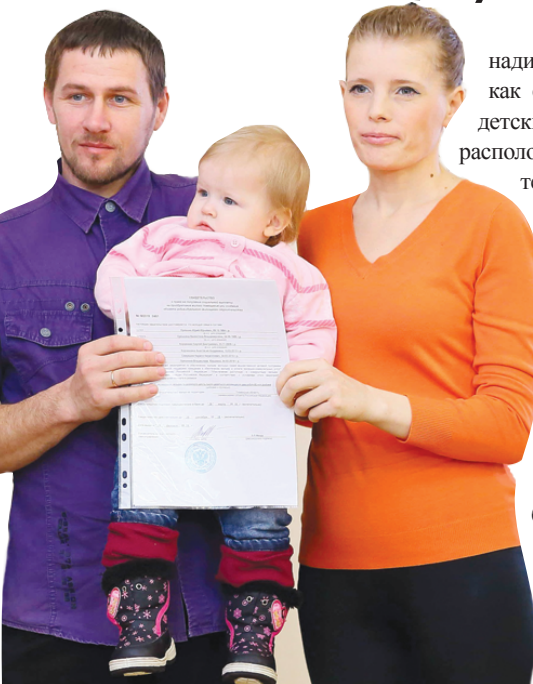
В 2019 году выделено более 55 млн рублей на социальные выплаты молодым семьям

Для сравнения: если в 2016 году на социальные выплаты было выделено более 40 млн рублей, то уже в 2019 – более 55. Ну, и конечно, количество улучшивших жилищные условия молодых семей увеличилось: в 2016 году – 44 семьи, в 2019 – 55.