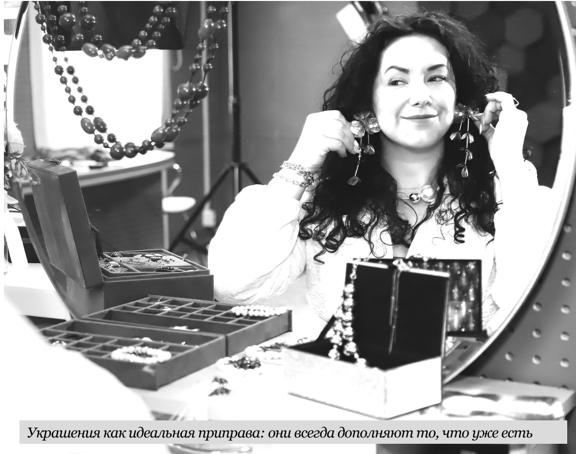
Украшения как идеальная приправа: они всегда дополняют то, что уже есть