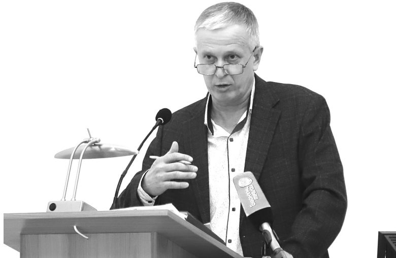
Заместитель главы муниципалитета дал голышмановцам развёрнутые ответы на заданные вопросы из сферы ЖКХ

– В декабре 2024 года депутаты окружной думы утвердили очередность ремонта дорог. В полном объёме удалось выполнить запланированные работы в 2025 году. В текущем на десять процентов снизилось финансирование программы ремонта дорог из областного бюджета, в то время как значительно выросли цены на строительные материалы и выполнение работ. Также, согласно судебному решению, необходимо выполнить ремонт на участке дороги в посёлке Голышманово на улице Энгельса, два квартала от улицы Комсомольской до улицы Красноармейской. Всего – около 450 метров, стоимостью 96 миллионов рублей. Дорожное полотно «закроют» железобетонными плитами, подъезды к домам проектом не предусмотрены. В планах на 2026 год – строительство 330 метров дороги на улице Полевой, от улицы Красноармейской до улицы Карла Маркса. Также будет проведён ямочный ремонт по факту весеннего обследования дорог в посёлке Голышманово и на сельских территориях. Поэтому пока откладывается ремонт дорог в переулках Луговом и Шевченко, на улице Шабалиной и строительство подъезда к зданию бассейна на улице Садовой, – объяснил заместитель главы Голышмановского