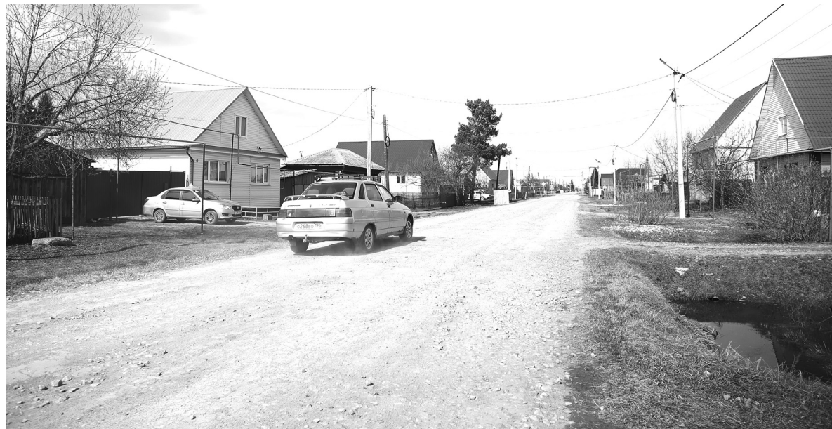
В этом дорожно-строительном сезоне капитально отремонтируют участок дороги на улице Энгельса в посёлке Голышманово – от Комсомольской до Красноармейской

Наталья ГЛАДКОВСКАЯ