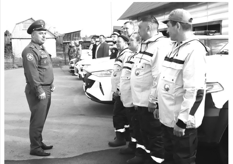
В патрульно-контрольные формирования входят сотрудники МЧС, полиции, Госавтоинспекции, Росгвардии и представители департамента лесного комплекса Тюменской области

В Голышмановском округе прошёл строевой смотр патрульно-контрольных формирований.