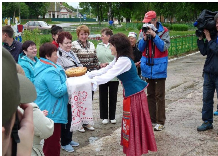
➤ Хлеб и соль. Встреча на рогинской земле

Так, по иронии судьбы и по незнанию своих корней, слу-