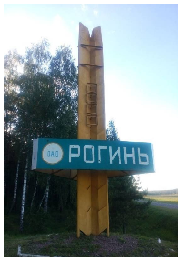
➤ Поворот на село Рогинь. 2 июня 2017 г.