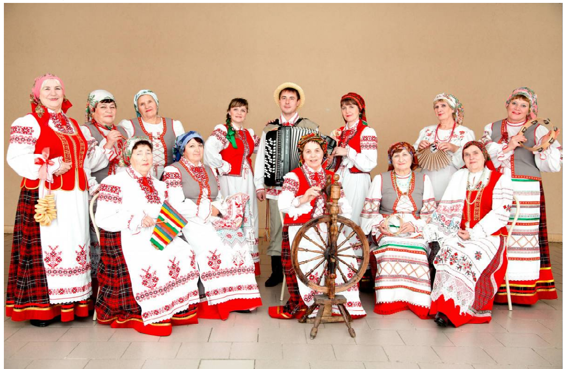
➤ НФЭА «Вячорки»