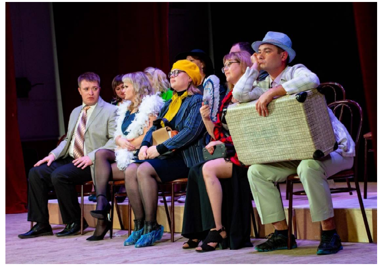
➤ Любительский театр «Место Действия»

Примечательно, что в Викуловский район отпущено сразу несколько победных дипломов! По итогам конкурсного отбора в номинации «Фольклорные коллективы и