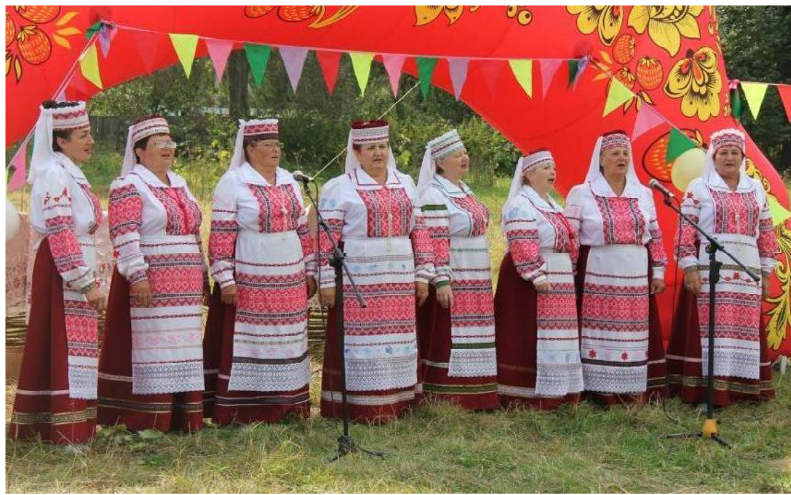
➤ НФА «Россияночка», с. Ермаки