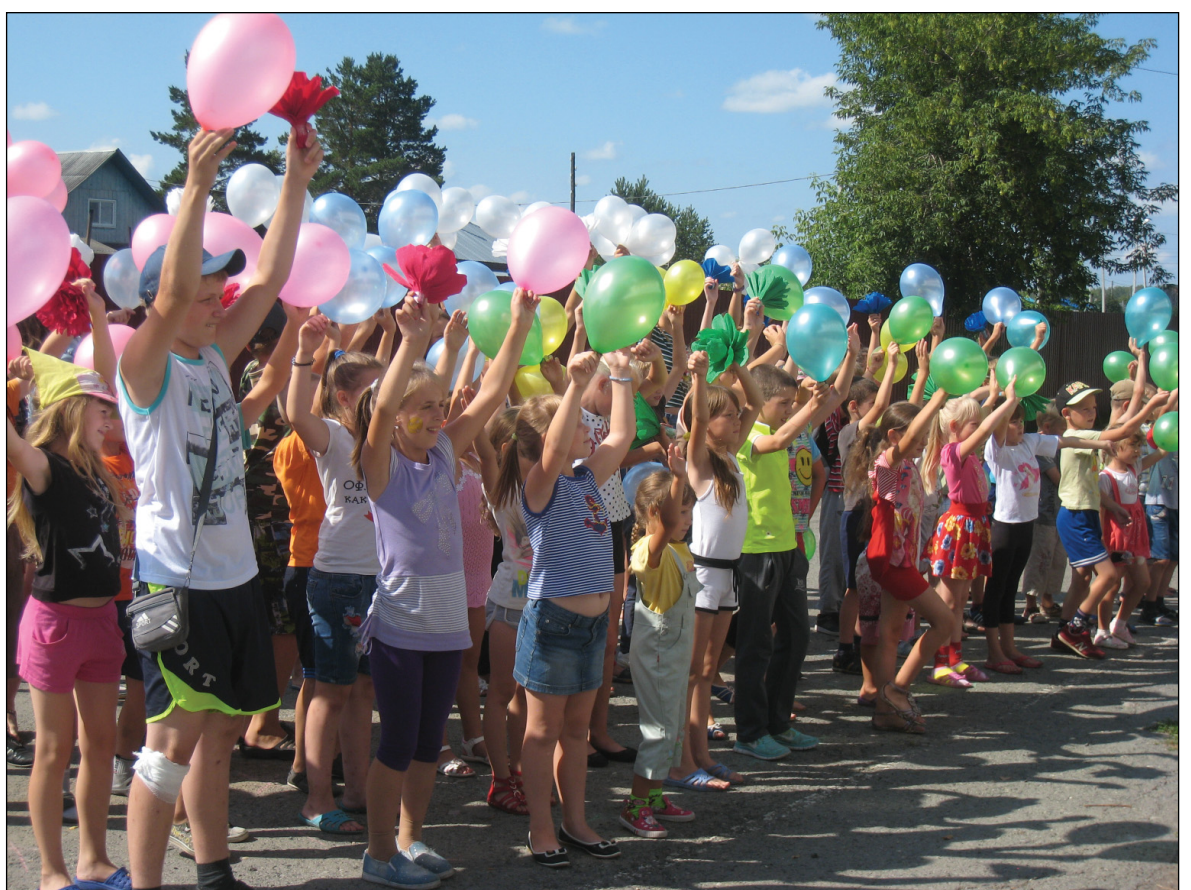
• Весёлой акцией праздник области отметили аромашевские ребята.

В рамках проекта «Я выбираю Тюменскую область» в Доме детского творчества совместно с КЦСОН 12 августа прошёл флешмоб «Я люблю Тюменскую область». Мероприятие также было приурочено ко Дню образования нашей области.