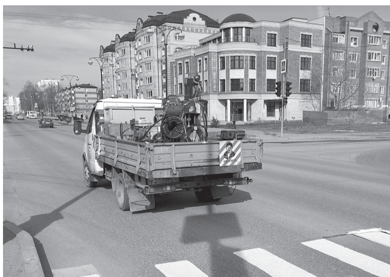
Дорожные работы – в приоритете