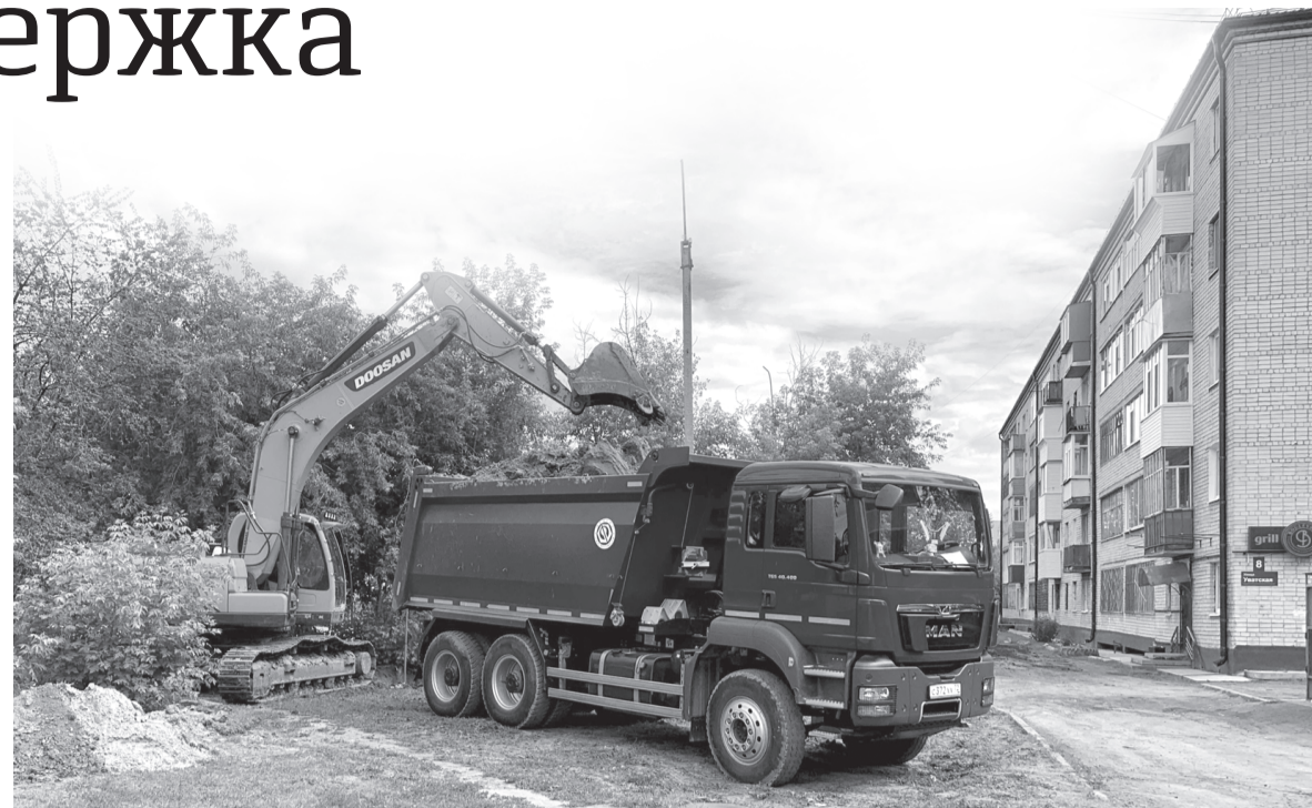
Благоустройство придомовой территории – один из наказов депутатам гордумы

– Другое, не менее важное направление деятельности городских депутатов – это реагирование на конкретные обращения граждан и организаций. За 2019