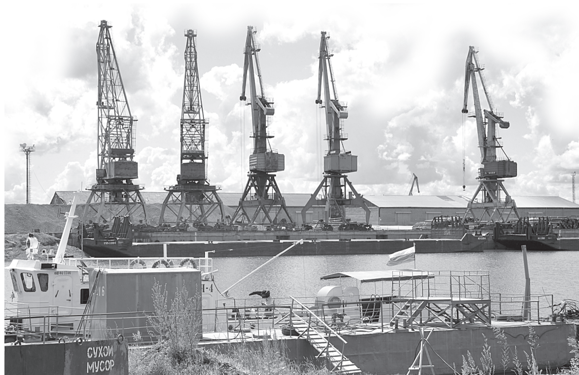
В акватории Тобольского речного порта