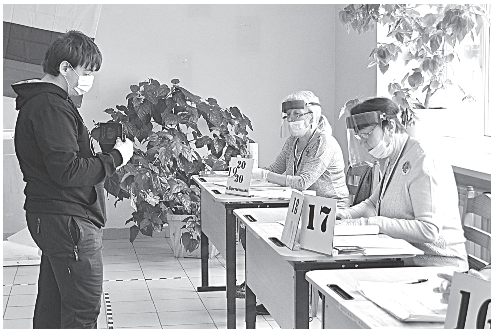
Голосующему впервые – особое внимание

Завершилось одно из главных событий года – голосование по внесению изменений в Конституцию Российской Федерации.