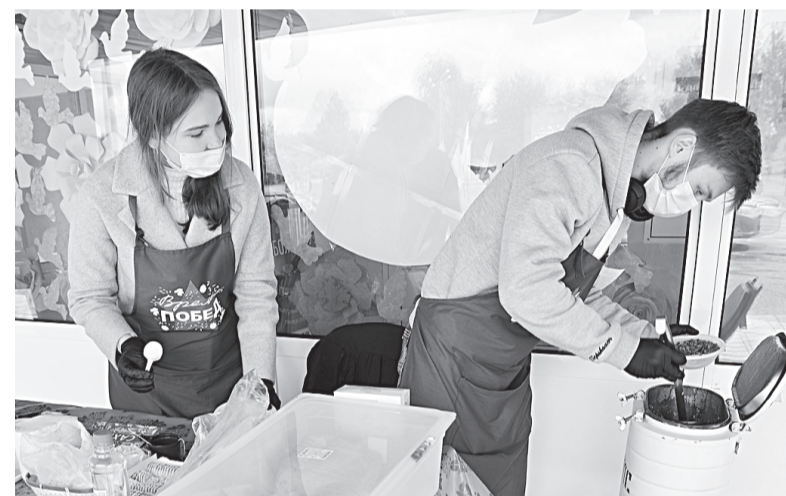
Гречневая каша с мясом - угощение, от которого невозможно отказаться

В рамках фестиваля была организована работа двух палаток здоровья на территории школ №№ 1 и 5. В условиях пандемии коронавируса, когда тобояки стараются по возможности избежать посещения лечебных учреждений, палатки здоровья на свежем воздухе оказались весьма востребованными. Здесь тобояки могли измерить артериальное давление, пройти исследование на холестерин, биоимпедансометрию, получить консультацию терапевта.